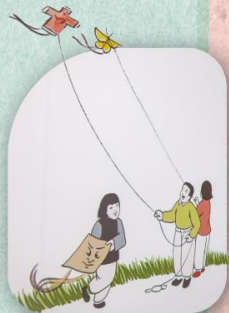
▲ 漫畫家豐子愷筆下的放風箏情境。