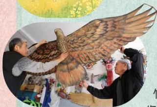
▲ 今天的工匠利用梧桐木製作木鳶風箏。