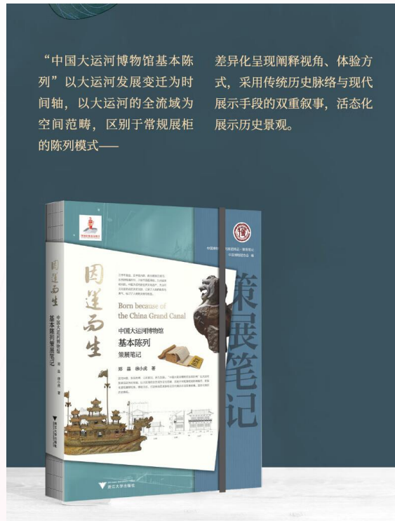
中國大運河博物館