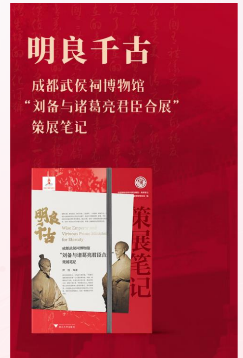
成都武侯祠博物館