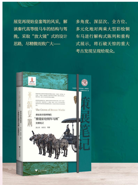
秦始皇帝陵博物院