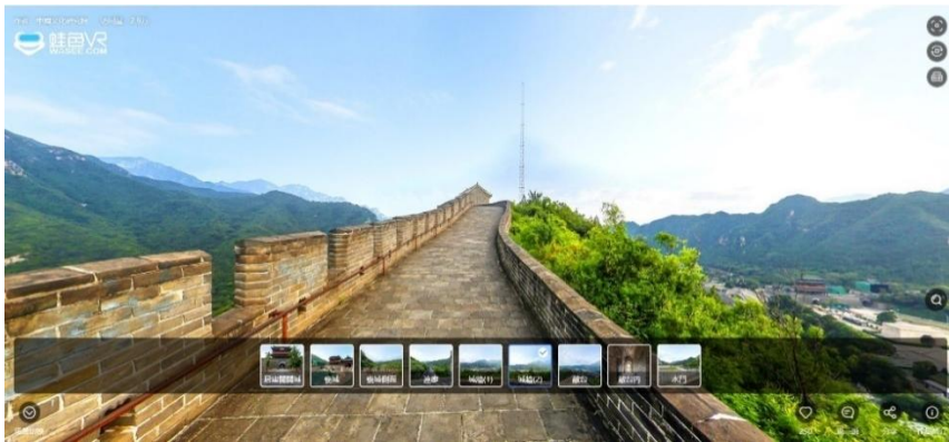
居庸關明長城 360 全景圖

https://bfaquzm4o.wasee.com/wt/bfaquzm4o?def_sid=1978612&ath=269.8952&atv=-4.6527