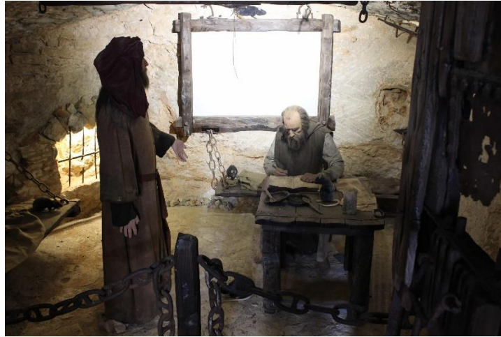
馬可孛羅在獄中口述遊記的情景

《馬可孛羅遊記》被譽為「世界一大奇書」，共分四卷，記述馬可孛羅東遊沿途見聞、忽必烈及其宮殿、都城、活動等事、在杭州、福州、泉州，以至日本、越南、印度的遊歷，以及成吉思汗後裔的戰爭等。在書中出現的國家或城市多達一百多個，還有這些地方的山川地形、物產、氣候、貿易、居民、宗教、風俗習慣、民間軼事等，內容極之豐富，好比今天的「旅遊大百科」。