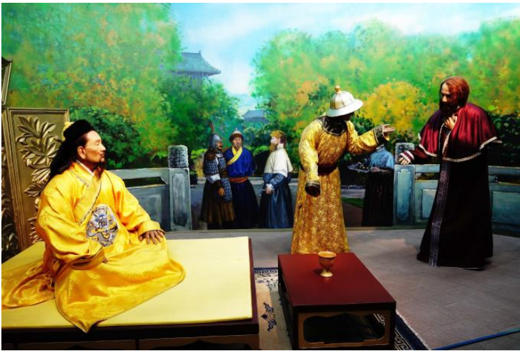
忽必烈會見馬可孛羅的蠟像

馬可孛羅一行三人在中國居住下來，一住就住了十多年。根據遊記記述，忽必烈很喜歡聰明伶俐的馬可孛羅，甚至派他做元朝的外交使臣、地方官員，遊歷了中國很多地區。直到1291年，他們才開始啟程返回故鄉。