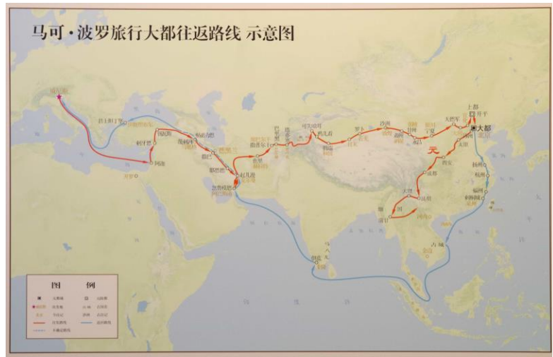
馬可孛羅旅行大都往返路線示意圖

回到威尼斯後不久，當地爆發戰爭，馬可孛羅也參與其中。後來馬可孛羅成為了戰俘，在獄中與小說家露絲蒂謙（Rustichello）成為朋友。馬可孛羅周遊東方世界的故事，引起了露絲蒂謙的關注和興趣，於是一人說故事，一人寫故事，一部轟動世界的遊記《東方見聞錄》，即《馬可孛羅遊記》（又名《馬可孛羅行記》），便於1298年誕生了。