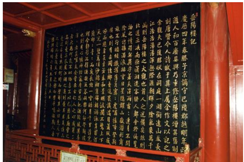
岳陽樓內由清朝書法家張照書寫的《岳陽樓記》木屏

如今，岳陽樓內一樓懸掛《岳陽樓記》雕屏及詩文、對聯、雕刻等；二樓正中懸有紫檀木雕屏，上刻有清朝書法家張照書寫的《岳陽樓記》；三樓懸有毛澤東手書的杜甫《登岳陽樓》詩詞雕屏，簷柱上掛有李白的對聯「水天一色，風月無邊」。