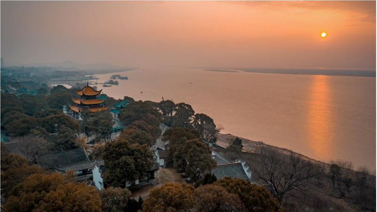
夕陽下的岳陽樓與洞庭湖美景

岳陽樓歷盡風雨滄桑，歷朝歷代都有損毀與修繕，現在的岳陽樓經過 1984 年落架大修後，基本保持了明清時代的風格，其中原有木構件保存了 55% 以上。