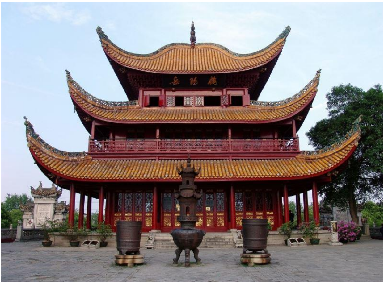
岳陽樓是著名的盔頂建築，四角飛簷翹起，極富特色。

在湖南省岳陽市的洞庭湖邊，有一座雄渾威武的三層樓閣，全樓採用木質結構，四角飛簷如展開的羽翼，頂覆琉璃黃瓦，古色古香，彷彿遠眺湖對面的君山島。這就是著名的岳陽樓。