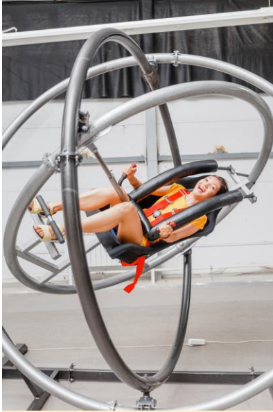
陀螺儀原理應用到現代的遊戲中