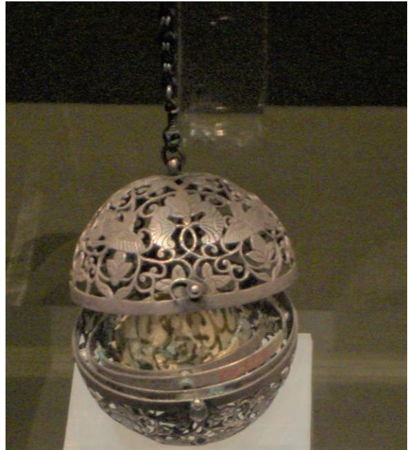
飛鳥葡萄紋銀香熏球。唐代使用香熏球普遍，在不同地方的遺址都出土過。

這個已有一千三百多年歷史的香熏球是一個直徑 4.6 厘米的球體，可上下開合，中間有一鈎鏈。球體頂部鑲有一條鏈，鏈長約 7.5 厘米。香熏球用銀製成，雕有葡萄、花鳥等圖案，精緻小巧，製作精湛。唐代人怎樣使用香熏球？據記載，富貴人家出行時坐馬車，會使婢女手持香熏球，又掛在馬車的帳上，當車駛過街道，香煙如雲，香氣飄散數里。也有把香熏球掛在床帳使用。這個香熏球運用了甚麼科學原理，使盛放香料的爐體能保持平衡，使點燃的香料不會傾灑出來呢？