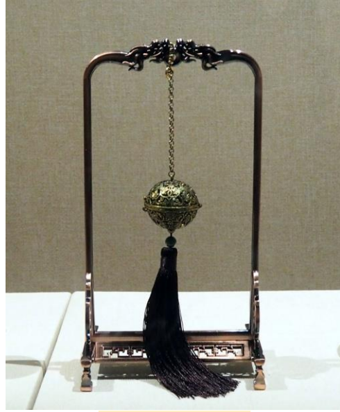
現代的雕漆香熏球