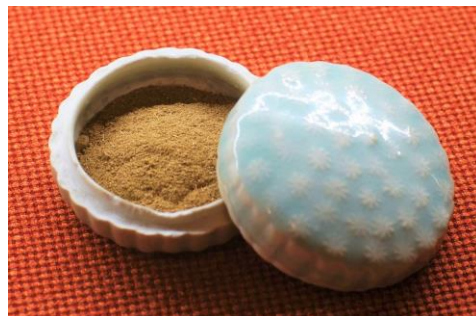
粉末狀的香料，也有香丸、香餅狀。