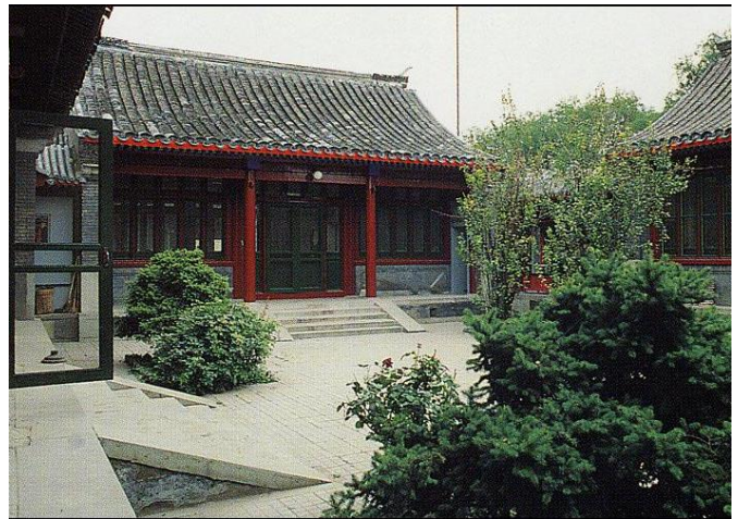
四合院中的庭院是家庭進行活動和休息的場所