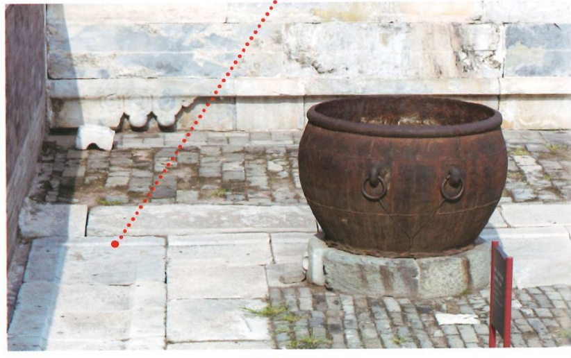
太和門北側的暗溝