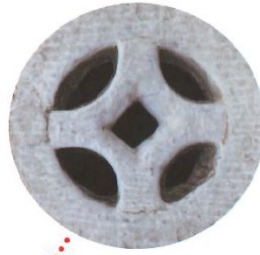
暗溝蓋板上的溝眼