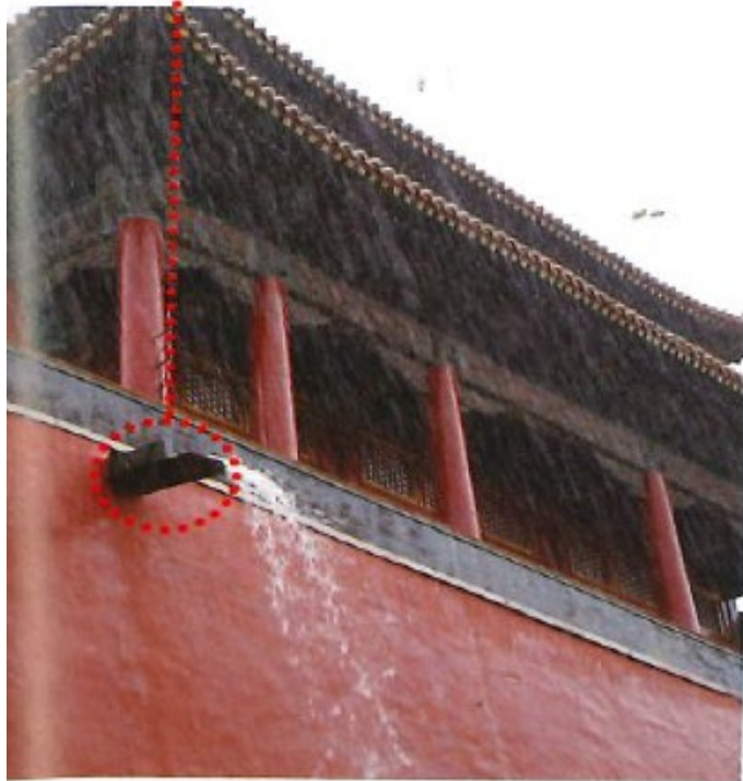
城台上的排水溝滴

第三類是城台上的排水溝滴的出入口。城台設計成外高內低，能把雨水匯集到排水石槽，再通過排水溝滴排走。