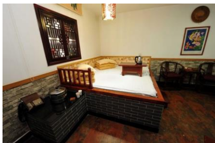
陝西延安市民俗酒店客房裏的牀是火炕

「火地取暖」的原理原來也見於民間。在中國北方一些地區，人們會睡在炕牀上。這是一種怎樣的設備？