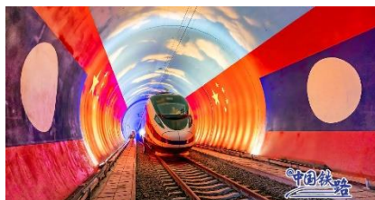
延續「一帶一路」戰略