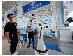
北京、上海、大灣區形成國際科技創新中心