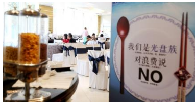
通過《反食品浪費法》，推行節約糧食