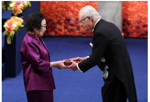
2015年12月，屠呦呦從瑞典國王手中接過諾貝爾獎獎章。