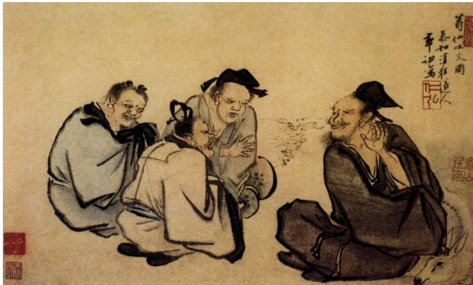
明代《葛仙吐火圖》。除醫學外，葛洪在煉丹中得出「丹砂燒之成水銀，積變又還成丹砂」的化學理論，頗具化學真知。

葛洪還對不少當時難以醫治的疾病加以深入觀察和鑽研。《肘後備急方》記載了古代治療瘧疾的方法，其中一個藥方：「青蒿一握，以水二升漬，絞取汁，盡服之」，更啟發中國當代科學家屠呦呦（粵[優]，普[yōu]）發現可抵抗瘧疾的青蒿素，造福世界，尤其是飽受虐疾困擾的非洲國家，她因而獲授予2015年諾貝爾醫學獎。由此可見，無論古今，不少中醫藥家都敢於嘗試和創新，為人類謀福祉。