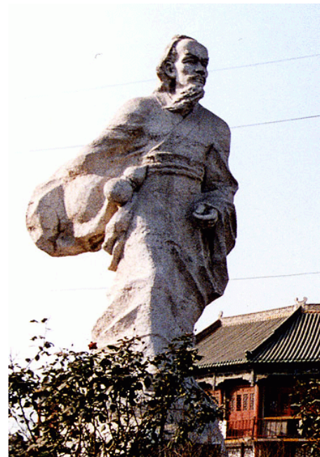
古代醫生常用葫蘆裝藥，華佗便經常隨身攜帶一個葫蘆，因此「葫蘆」後來也成為行醫的象徵，有謂「懸壺濟世」，葫蘆在古代稱作「壺」。