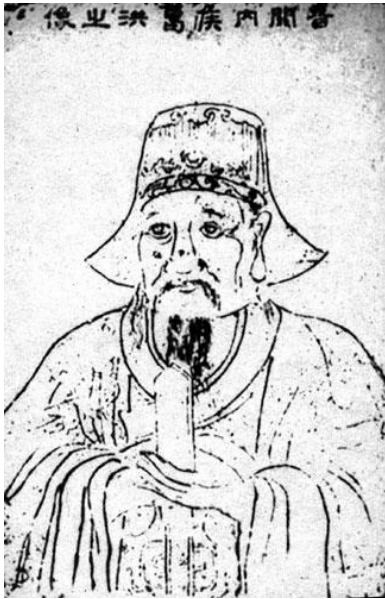
杭州西湖葛嶺葛洪石碑刻像