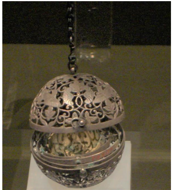
飛鳥葡萄紋銀香熏球。唐代使用香熏球普遍，在不同地方的遺址都出土過。

這個已有一千三百多年歷史的香熏球是一個直徑 4.6 厘米的球體，可上下開合，中間有一鈎鏈。球體頂部鑲有一條鏈，鏈長約 7.5 厘米。香熏球用銀製成，雕有葡萄、花鳥等圖案，精緻小巧，製作精湛。唐代人怎樣使用香熏球？據記載，富貴人家出行時坐馬車，會使婢女手持香熏球，又掛在馬車的帳上，當車駛過街道，香煙如雲，香氣飄散數里。也有把香熏球掛在床帳使用。這個香熏球運用了甚麼科學原理，使盛放香料的爐體能保持平衡，使點燃的香料不會傾灑出來呢？