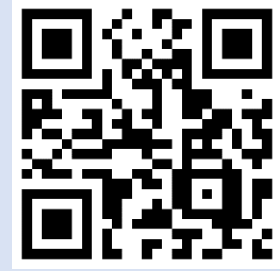
《江山多驕》第六集：留學目的地 https://youtu.be/ItfUD4GcJ4