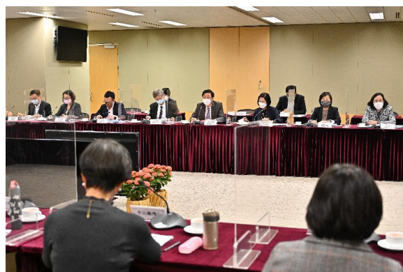
F. 就扶貧工作提出意見