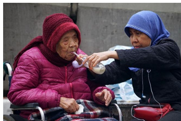
B. 提供長者生活津貼