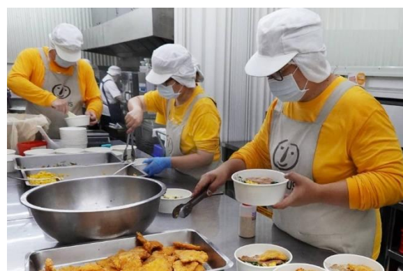
D. 開設社企顧用傷健人士