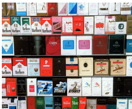
中国大陆各种假冒的名牌香烟

在现今世界各地，失信的现象十分严重，造成信用危机，影响经济发展，扰乱生活秩序。例如，在中国大陆，有些政府官员欺上瞒下，贪污情况严重。在商业交易中，假冒伪劣商品屡禁不止，目前中国约有 35% 的企业被假冒伪劣产品侵权，此类产品的产值年均高达 13,000 亿元。商家对顾客态度冷漠敷衍、虚假广告、毁合约、作假帐的现象相当普遍。凡此种种，不胜枚举。在香港，从二十世纪七十年代至今，也发生过不少惊人的贪污案件，如“葛柏案”、“律政高官受贿案”、“圆洲角短桩丑闻”，至于电话骗案、街头行骗、盗窃、信用卡赖帐等现象俯拾皆是。