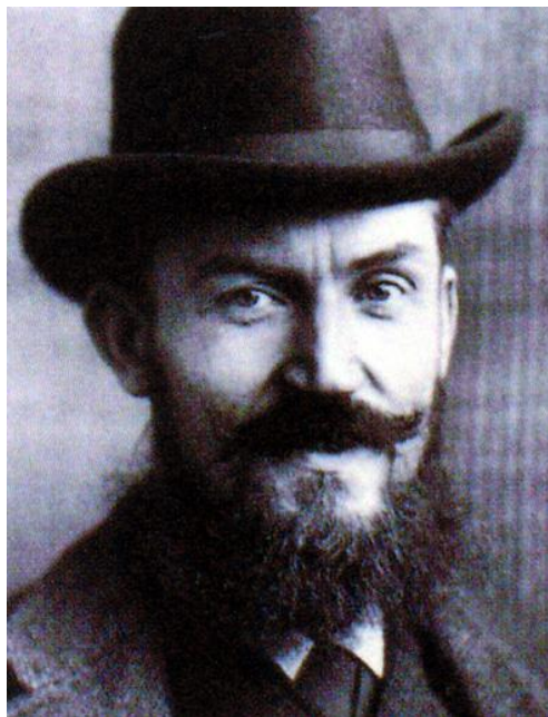
英国剧作家萧伯纳