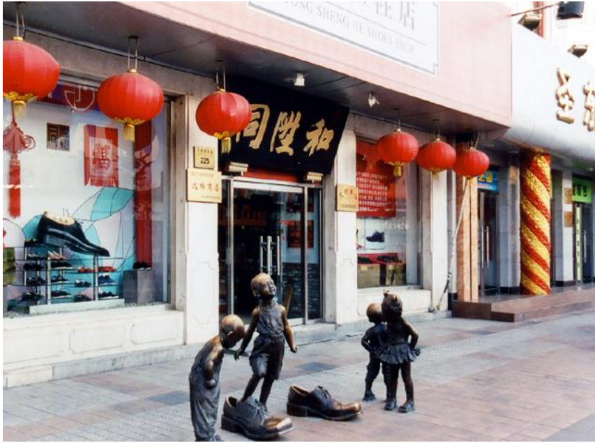
北京同陞和是百年老店，历久不衰，该店的鞋子深受老北京人喜爱