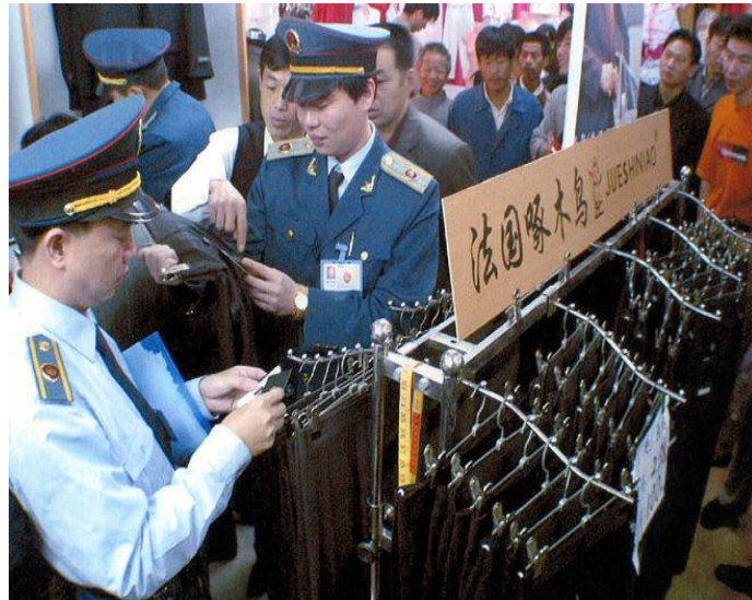
中国大陆的工商人员查处假冒的名牌西装

当现代人意识到自己可以积极争取权利和利益时，却错误地认为自由就是无规定和不受约束地为所欲为，因此人们往往为了一己私利而不择手段，损人利己，将道德规范、承诺信誉、合约法律置诸度外，作出种种自私行为。例如中国大陆的经济开始急促发展，但信用制度、市场规则尚未健全，于是一些见利忘义的人就会钻制度、法律不完备、执法不严的空子，不讲信用，形成现今种种“见利忘信”的现象。