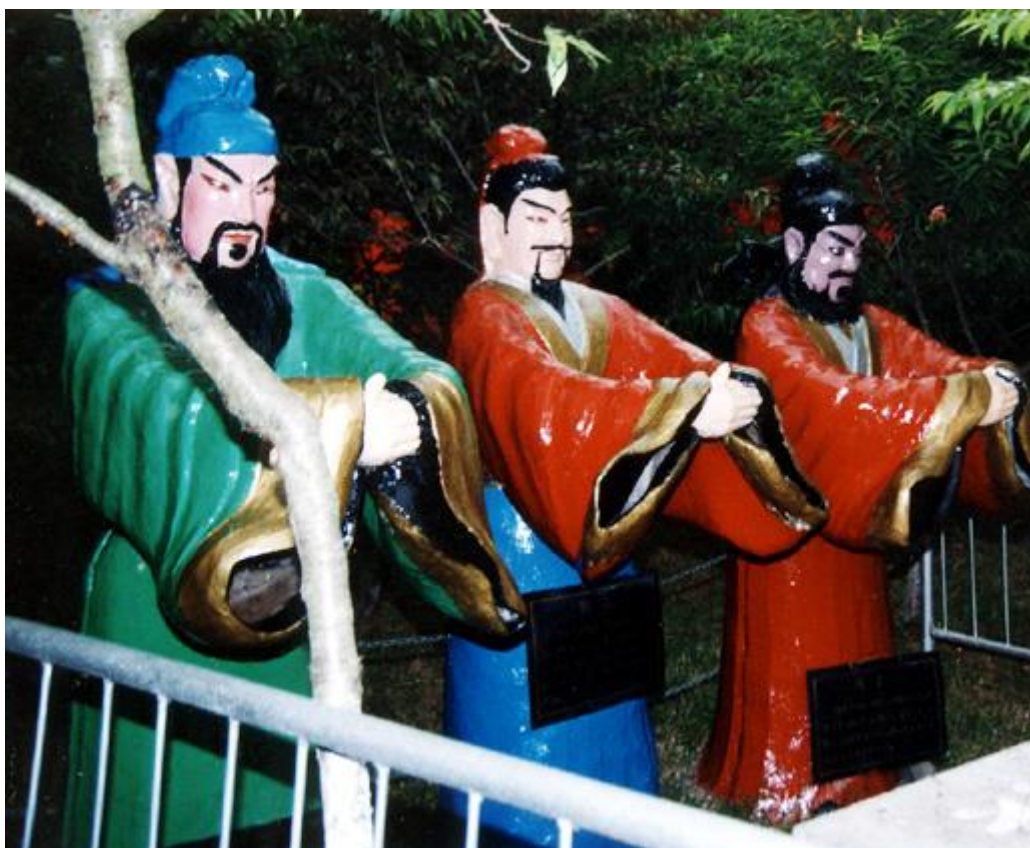
《三国演义》内描述的“桃园结义”，充分体现了古人交友时以信义为本

将友谊建立在志同道合、情趣相投的基础上，贵者一方不应以自己的年资、地位、权势、财富作为交友的资本，彼此应当相互尊重，做到正如《法言·修身》所言：“上交不谄，下交不骄。”遇到显贵的人，不会因此奉承巴结；遇到寒微的人，不会因此傲慢自大，这正是平等之交的可贵之处。