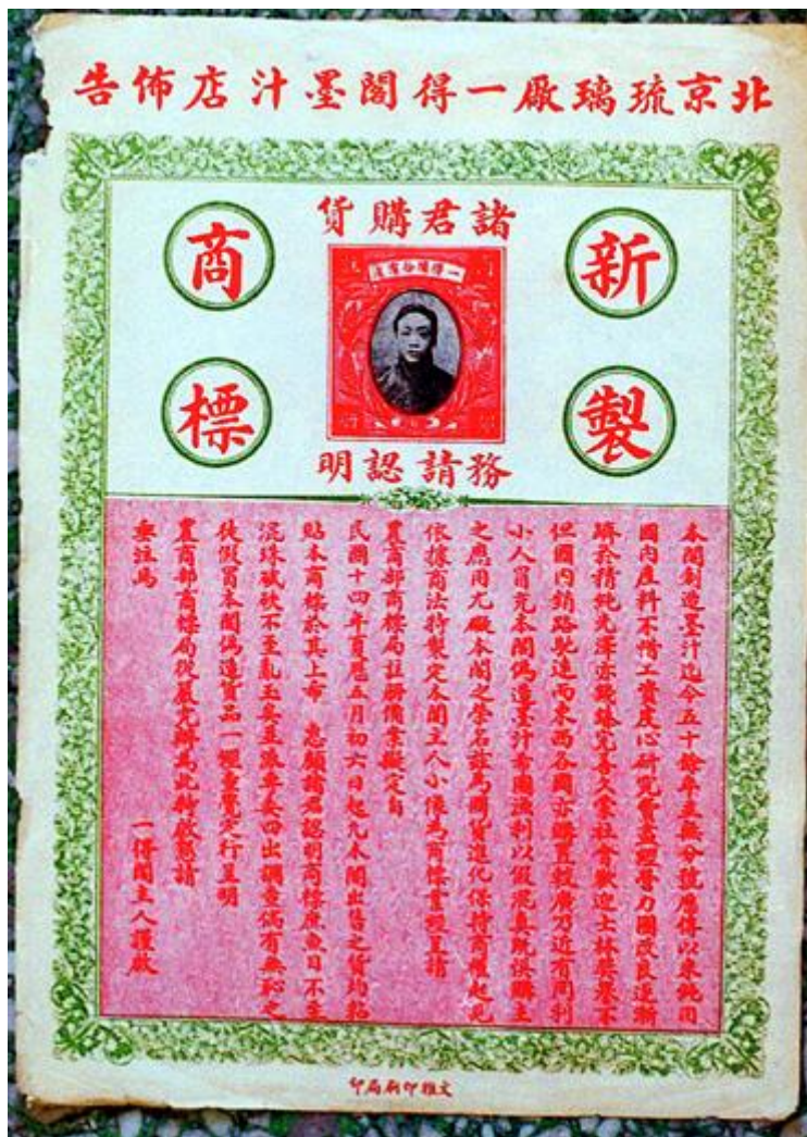
北京琉璃廠——得閣墨汁店的廣告，提醒消費者認明新製商標，提防假貨