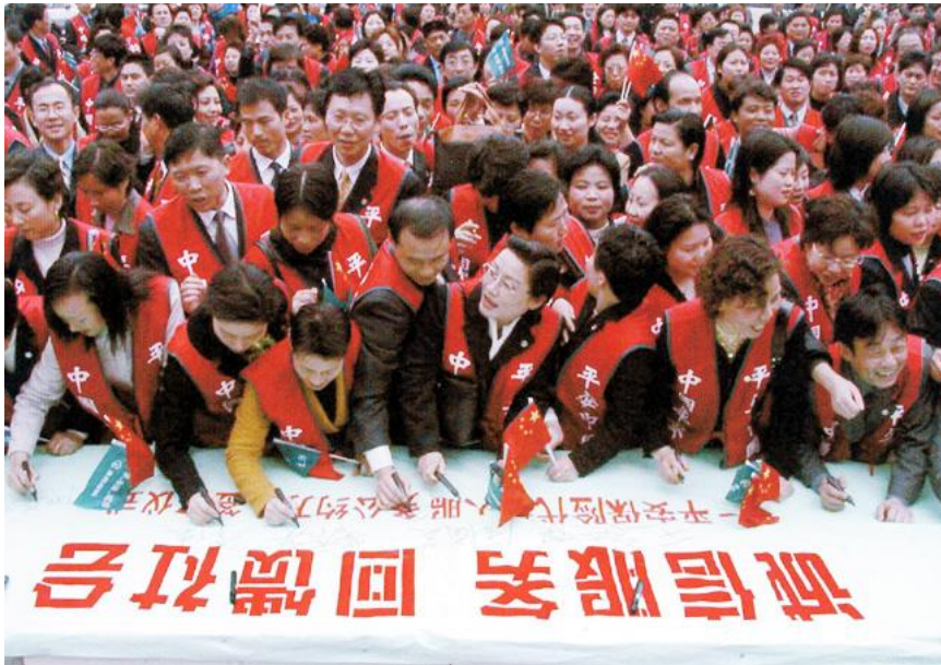
工作时应以诚信服务

要以诚相待，切不可互相猜疑，各怀鬼胎。古人云：“以诚感人者，人亦诚而应。”诚信具有双向性的，只有自己以诚对待同事和朋友，才能得到他人以诚相报。这样，同事之间的关系更为和谐融洽，大大提高工作效率。