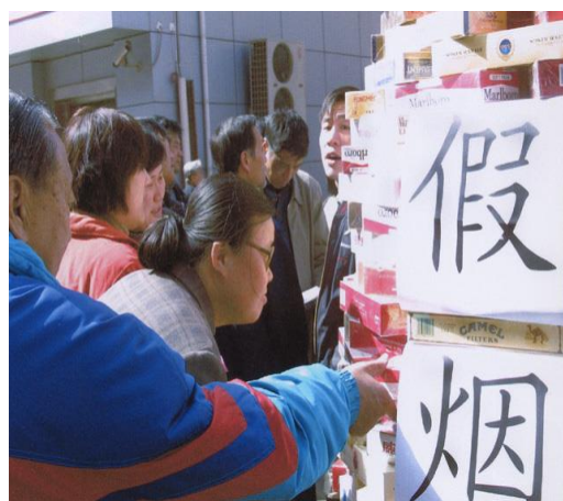
中国大陆有关部门展示假烟，让消费者识别真伪