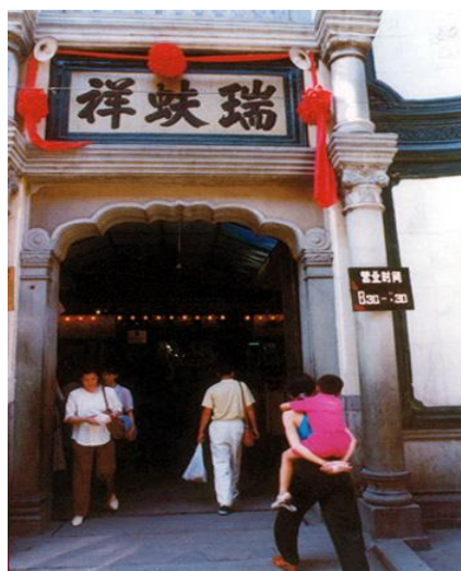
瑞蚨祥绸布店是北京的老字号，可见信誉口碑对营商是十分重要