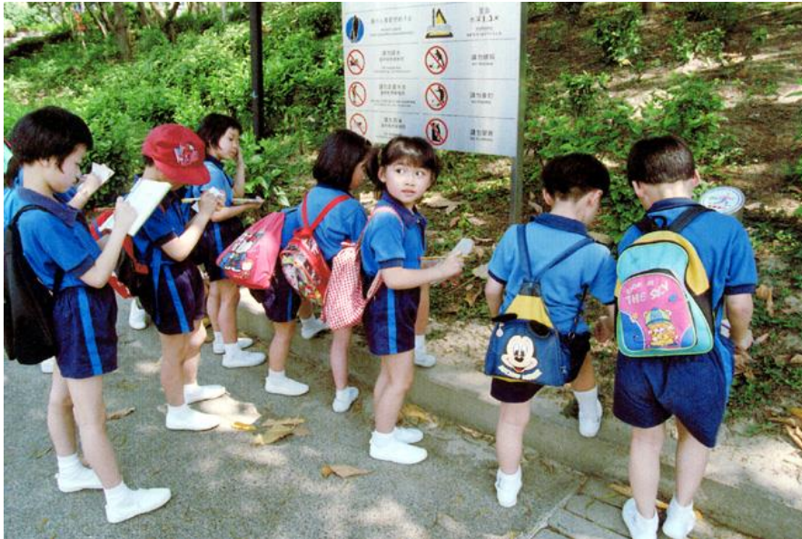
学校教育是重建诚信之道的其中一个重要方法

例如，香港的廉政公署会向政府部门、公营机构及非牟利机构，安排防贪教育课程或制定防贪计划，让机构内各职级的员工参与。在学校和家庭，提倡向下一代施以全人教育，提高道德修养。身为家长和老师，要严格、耐心地教导孩子，以身作则，必须谨言慎行，重诺守信，作为榜样典范。在中国大陆，颁布和实施的《公民道德建设纲要》是全民性的道德教育。民间推行的“儿童诵经”活动也是对幼儿培养道德品德的有为措施之一。