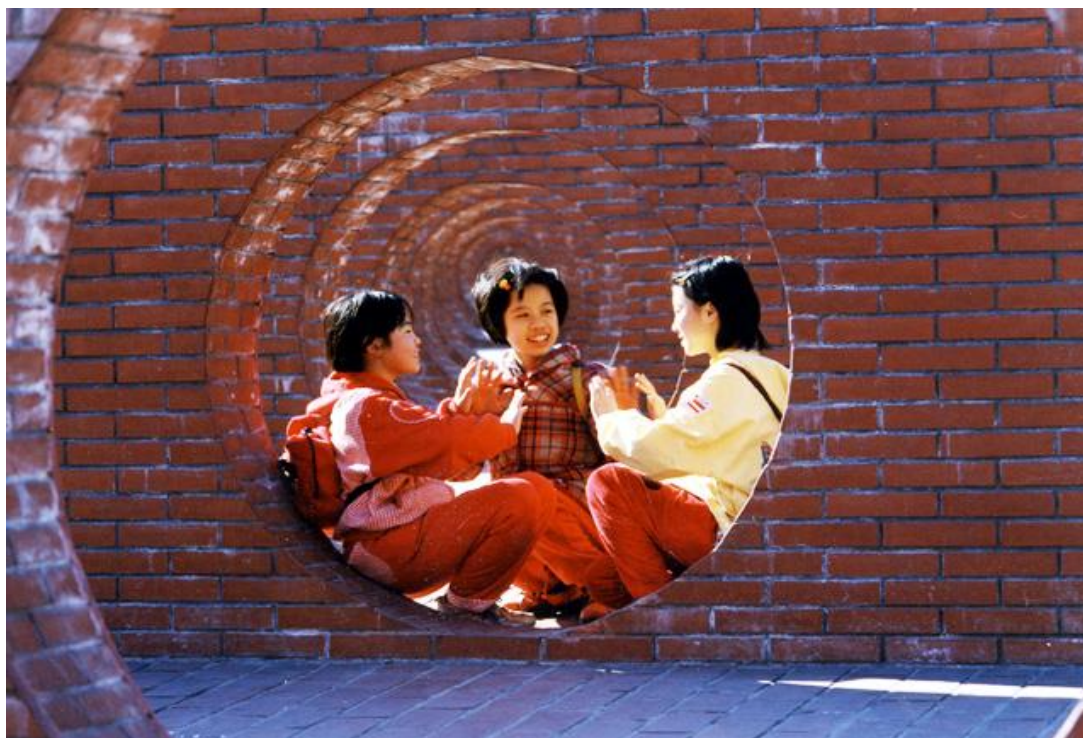
朋友的友善关系是从不说谎、互相信任开始

朋友之间必须诚实忠信，《论语·学而》曰：“与朋友交，言而有信。”一旦欺骗朋友，朋友也不会信任自己，便会破坏大家的友谊。而真的朋友，能做到如《礼记·儒行》所言：“久不相见，闻流言不信。”就算大家很久没见，当听到有关朋友的谣言，彼此仍能互相信任。