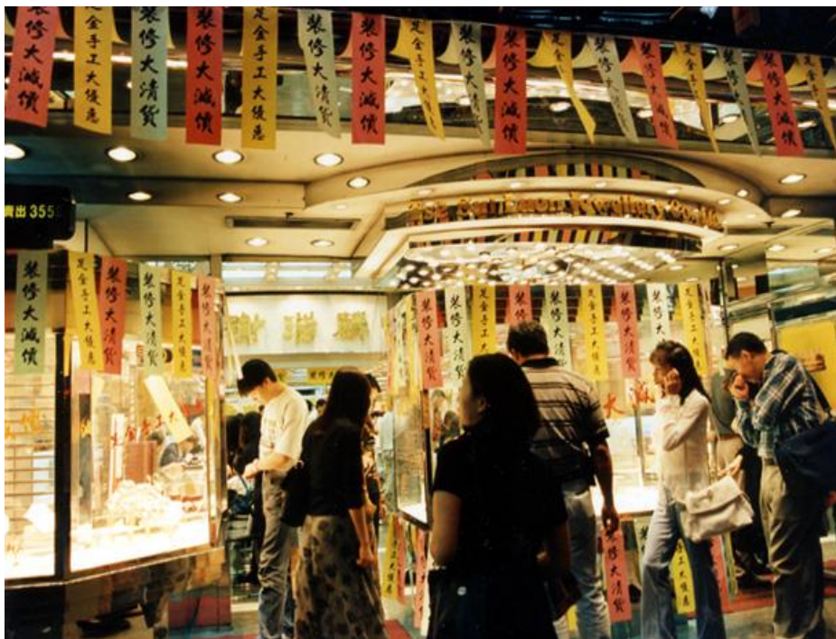
不少游客到香港观光购物，货真价实，待客以诚是促进旅游业的重要因素