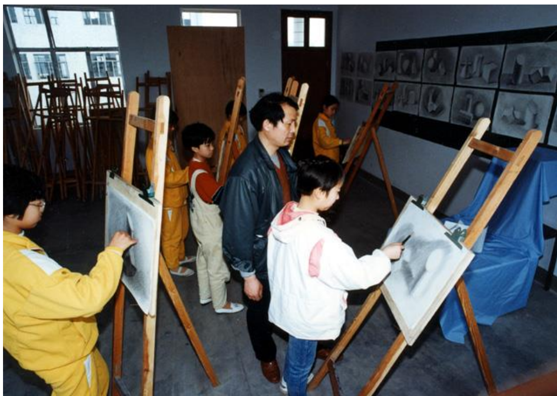
认真学习，才能学到真本领