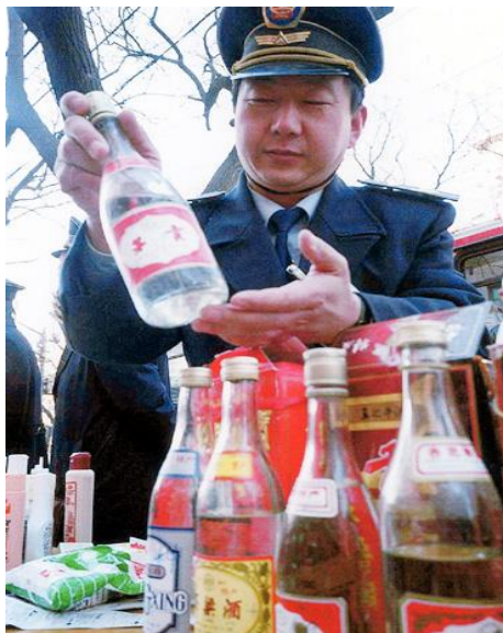
中国大陆工商人员展示假酒，让消费者识别真伪