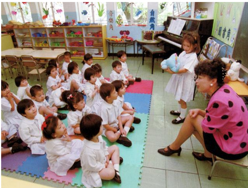
诚信的品德应自幼培养