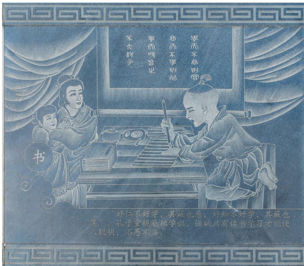
描繪古代學習的壁畫

意思是當世人還沒有察覺禍患而感到憂慮之前，自己就事先憂慮籌劃；當世人都已經安居樂業，感到快樂歡欣時，自己才安心快樂。