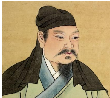
司馬光畫像

司馬光白天忙於公事，只好在晚上念書，直至深夜才到臥室睡一會，五更時又起來讀書或寫文章。為免自己睡得太久，他用一段圓木頭來代替枕頭。圓木枕很堅硬，與腦袋接觸面小，睡久了便會覺得不舒服，想翻個身，但當頭一離開圓木枕，圓木枕就滾開，頭便會碰撞到床板上。這時司馬光就會清醒過來，回到書房繼續讀書。日子一久，他跟圓木枕產生了感情，還親切地稱它為「警枕」呢！