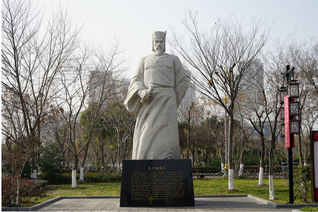
范仲淹雕像

這位有志氣的少年，就是日後北宋有名的政治家、軍事家和文學家范仲淹。由於他出身貧窮，了解百姓的疾苦，所以他當官後，便實行不少利國利民的改革措施，深得人民愛戴。