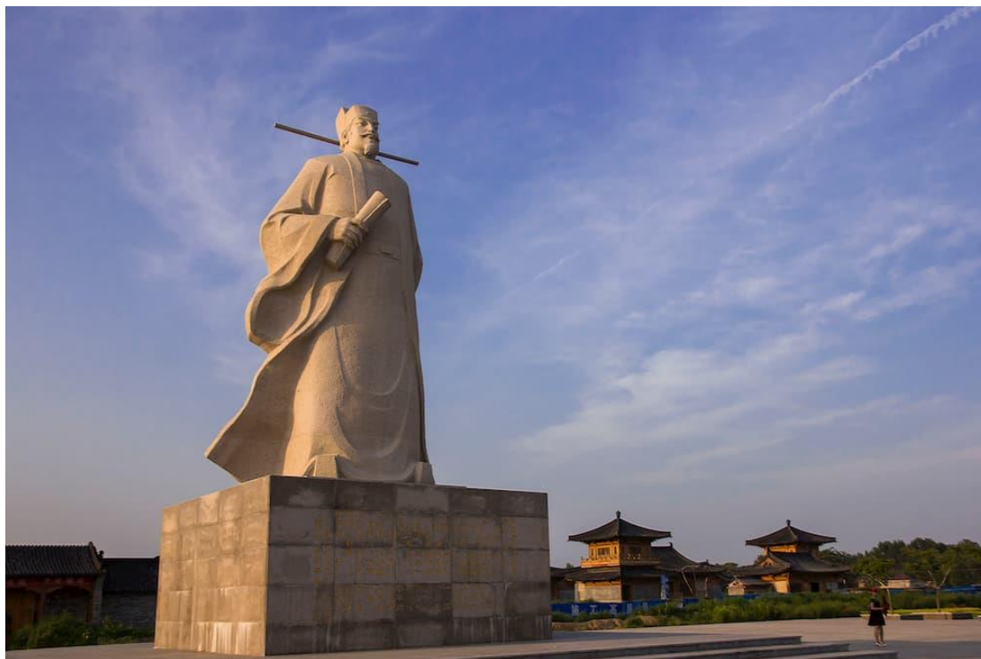
歐陽修雕像