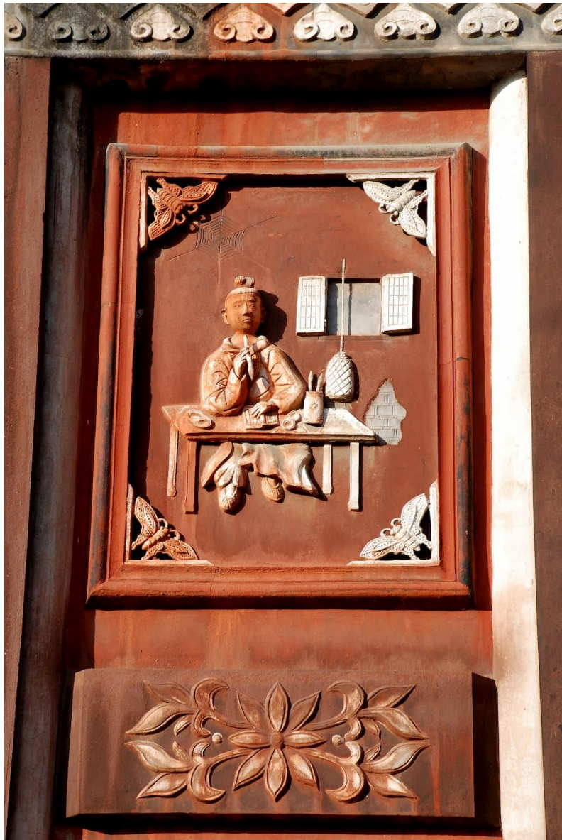
湖南張家界普光禪寺文昌祠門坊有車胤囊螢照讀的雕塑