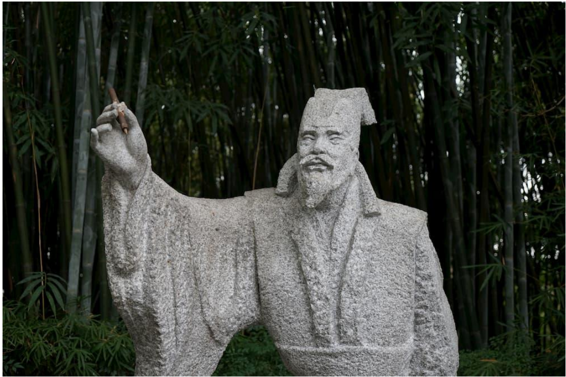
四川省成都市浣花溪公園內的白居易雕像

教，白居易解釋說：「我的詩是寫給老百姓看的，假如連一個不識字的老婆婆都聽不懂，那寫來有甚麼用呢？」