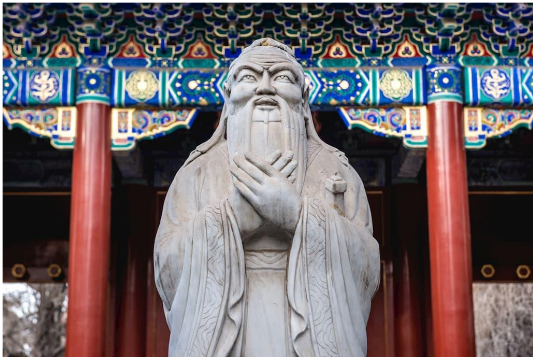
孔子雕像

孔子是中國偉大的思想家和教育家。他十分好學，當他知道晉國樂師襄子的琴藝高超，便不惜千里迢迢到晉國向襄子求教。襄子教孔子彈奏一首樂曲，十多天後，襄子認為孔子已掌握了樂曲的節奏和技法，可以學其他新曲了。然而，孔子卻要求繼續練習原曲，直至能明白樂曲的主題和深刻意義。又練了一段時間，襄子認為可以了，但孔子認為自己還沒理解樂曲所刻畫的主人翁，所以要求繼續練習這樂曲。孔子不斷地練習，一個活生生的人物形象，漸漸在樂韻中顯現出來……「這不正是施行德政的周文王嗎？」兩人興奮地叫了起來。原來這首曲正是歌頌周文王的《文王操》！