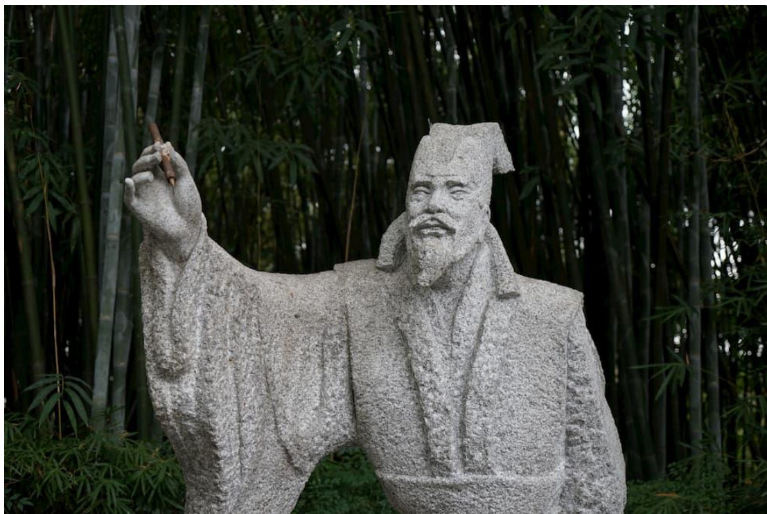
四川省成都市浣花溪公园内的白居易雕像