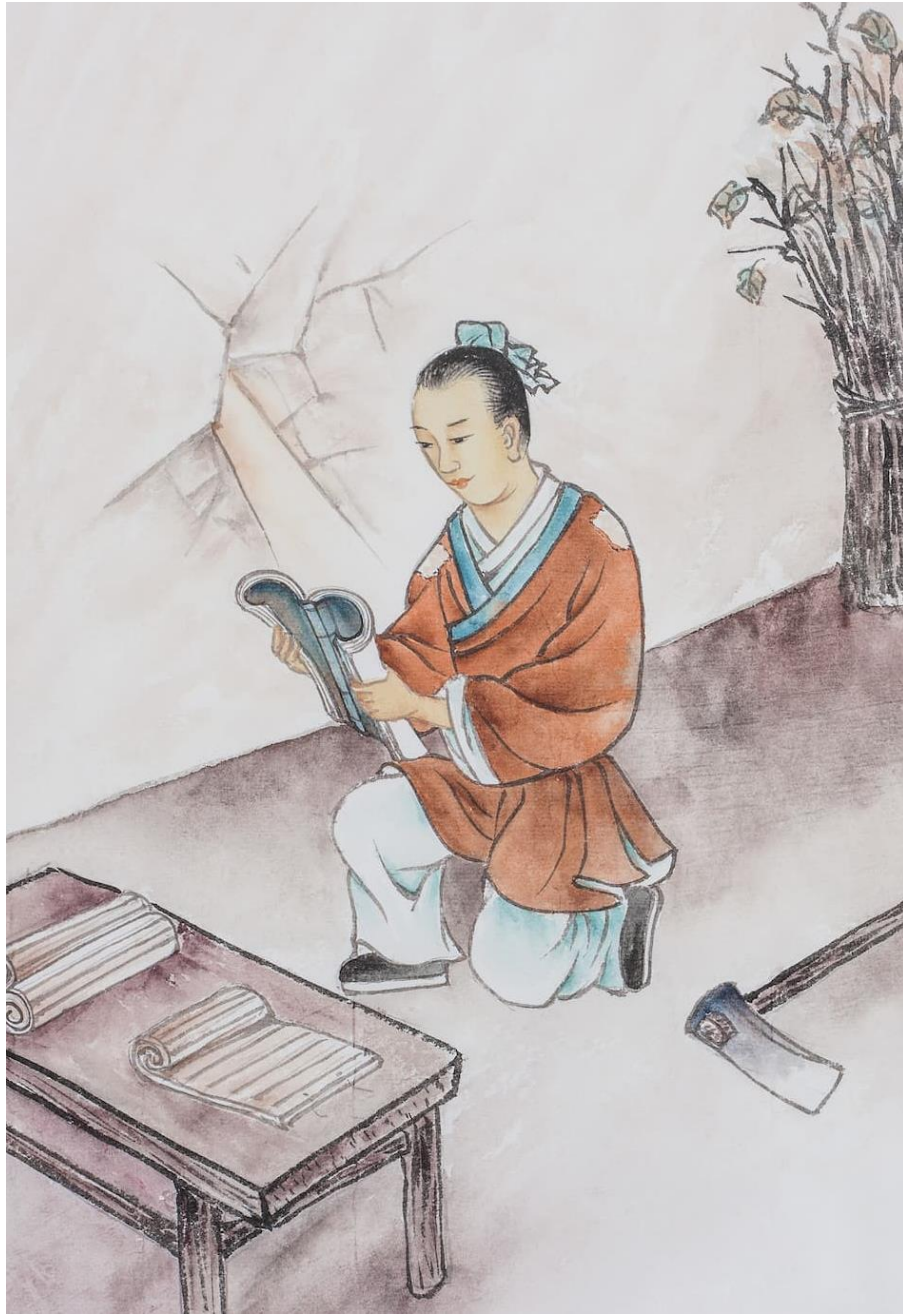
匡衡凿壁偷光苦读