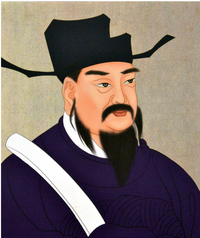
沈括，中国金融博物馆藏品