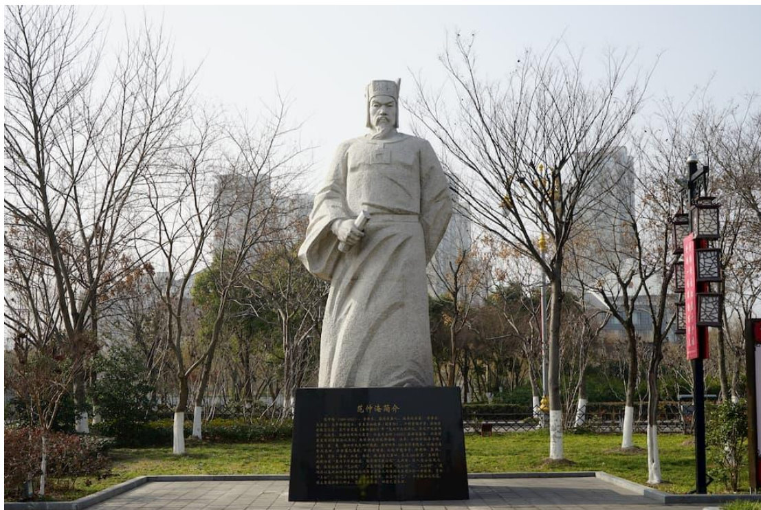
范仲淹雕像

这位有志气的少年，就是日后北宋有名的政治家、军事家和文学家范仲淹。由于他出身贫穷，了解百姓的疾苦，所以他当官后，便实行不少利国利民的改革措施，深得人民爱戴。