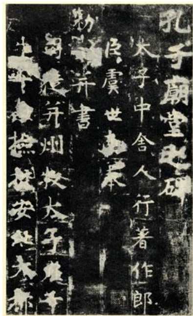
唐虞世南《孔子廟堂碑》（局部）

唐太宗撰寫的《帝範》，更可看作是貞觀君臣論治和唐太宗本人讀書學習的總結。唐太宗除了組織學者編撰《群書治要》、《五經正義》，修撰《隋書》、《晉書》等六史外，對文學、藝術也很重視。他能寫詩，《全唐詩》中就收錄了他所寫的詩歌八十八首。「疾風知勁草，板蕩識誠臣。」這千古傳誦的名句，便是出自唐太宗的《賜蕭瑀》一詩。