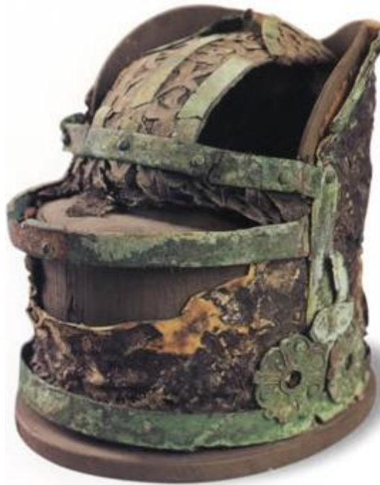
李勣墓出土的「三梁進德冠」

貞觀二十一至二十二年（公元 647 至 648 年），唐軍同時在西域和東北，對突厥、高麗作戰，又徵發江南、劍南二道民工造船，兵役、徭役空前繁重，有的地方人民因而起來反抗。但從當時的全國形勢來看，人民的反抗還只是一種暫時及局部的現象。當停止戰爭，減輕徵發後，局勢很快就穩定下來。