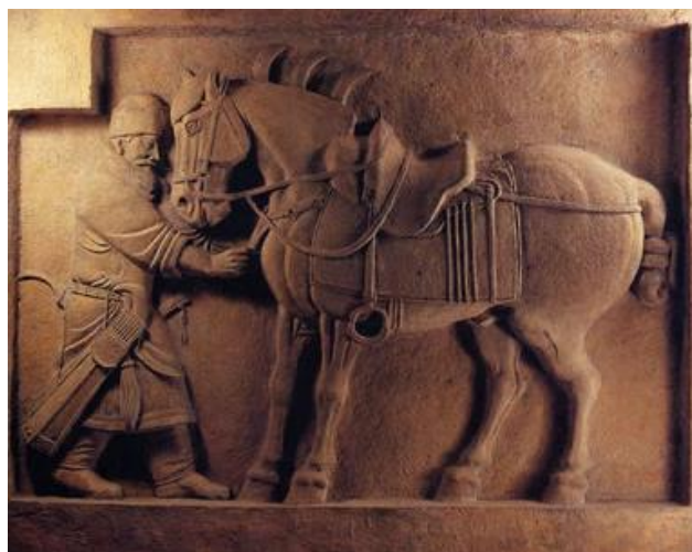
昭陵六駿之四：颯露紫（復原模型）