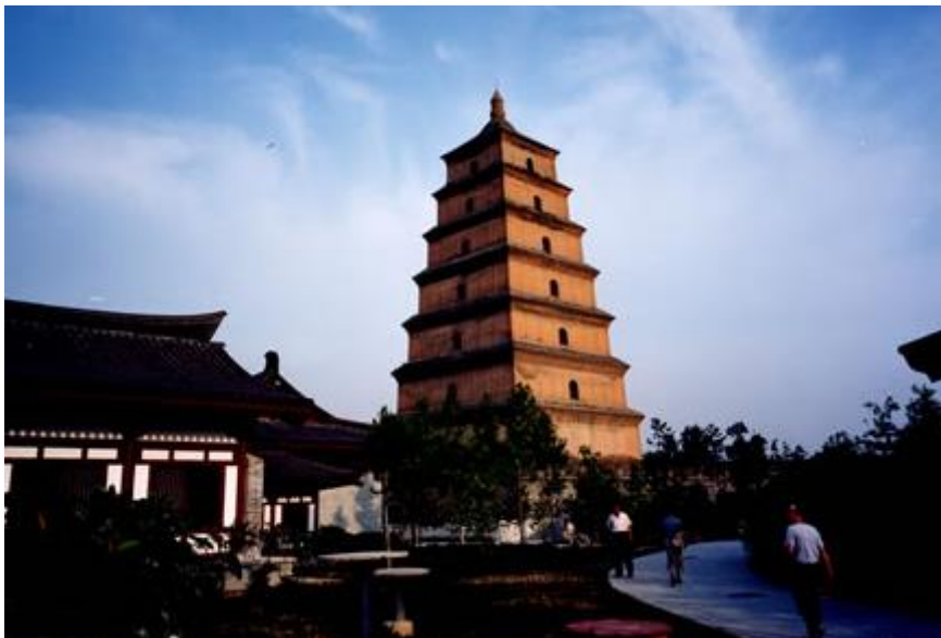
大雁塔，本名慈恩寺塔，是一座典型的樓閣式塔，當時此塔存放着唐代高僧玄奘從印度取回的梵文佛經