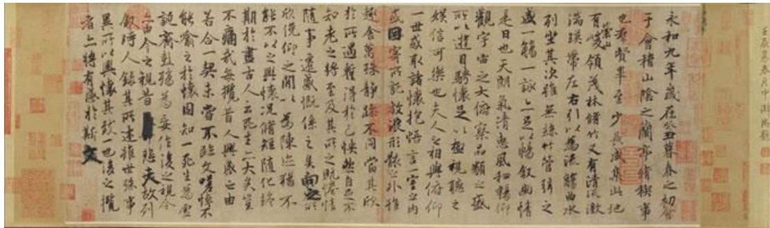
東晉·王羲之（蘭亭序）。此為宋本摹本