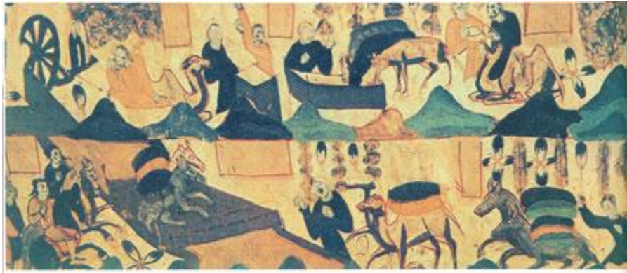
《商旅圖》壁畫，描繪了盛唐之世貿易流通的景象

唐太宗貞觀年間，國內形勢安定，社會經濟逐漸由恢復階段走向發展階段，農村面貌有了很大的改變。當時，國勢強盛，唐政府與周邊民族有着良好的關係。同時，中外交流頻繁，文化繁榮，在文化藝術上有許多新的創造。因此，貞觀時期歷來被稱頌為中國古代的一個理想治世。