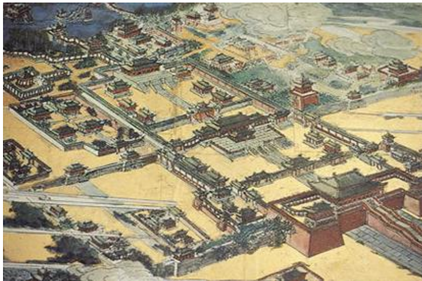
唐長安城大明宮復原圖

在這樣的情況下，武德九年（公元 626 年）六月初四，李世民在妻弟長孫無忌、謀臣房玄齡和杜如晦的幫助下，對太子發動了突如其來的襲擊。在皇宮北門玄武門，李世民事先埋下伏兵，乘李建成入朝沒有防備，親自射殺李建成，齊王李元吉也被尉遲敬德殺死，這就是歷史上有名的「玄武門之變」。不久，唐高祖李淵被迫退位，李世民登上了皇帝的寶座，是為唐太宗。