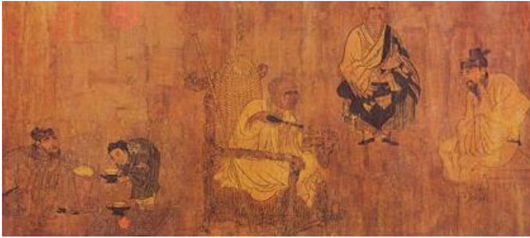
唐·閻立本（蕭翼賺蘭亭圖）