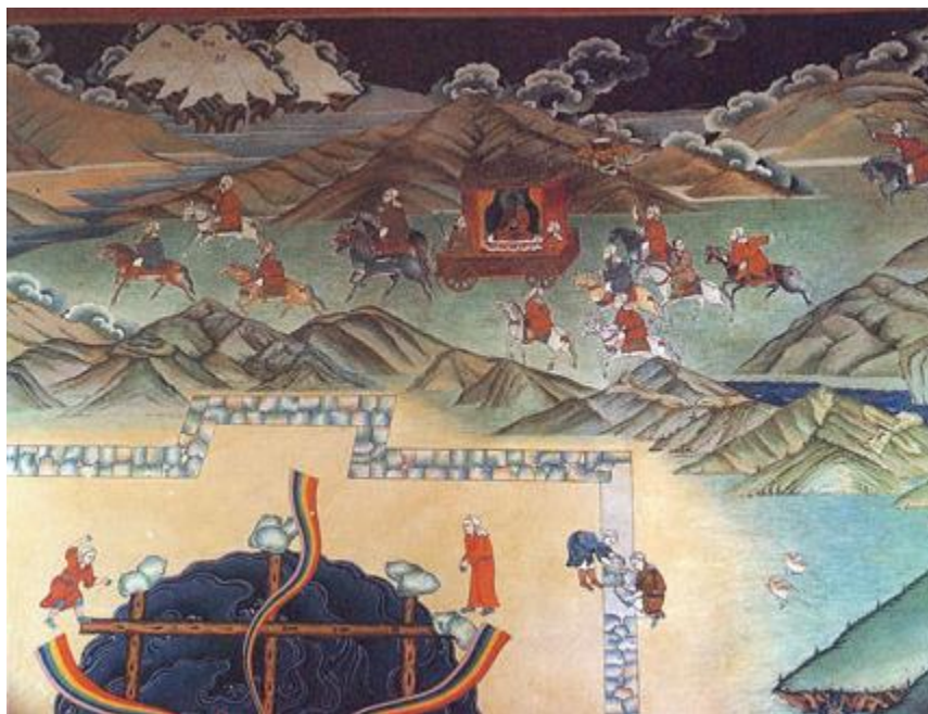
西藏大昭寺內的文成公主入藏壁畫