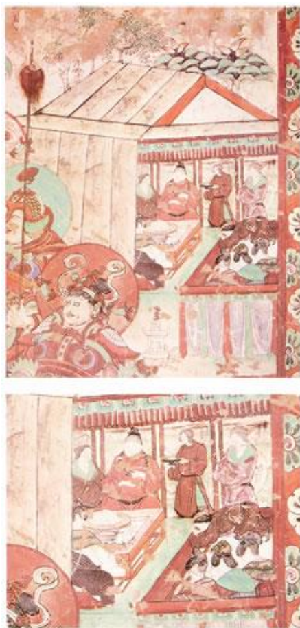
彌勒經變：嫁娶（郭煌莫高窟壁畫）

唐太宗在閱讀《明堂針灸書》時，發現人的五臟都在背部，因而下詔自今以後不得鞭打囚犯的背部，以免造成傷殘，影響日後的生產勞動。貞觀三年，太宗下令諸州設醫學，以助提高人民的健康水平，有利生產。這些都是唐政府為保護勞動力而做的努力。