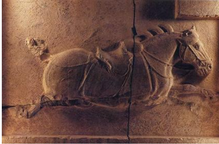
昭陵六駿之一：青騅