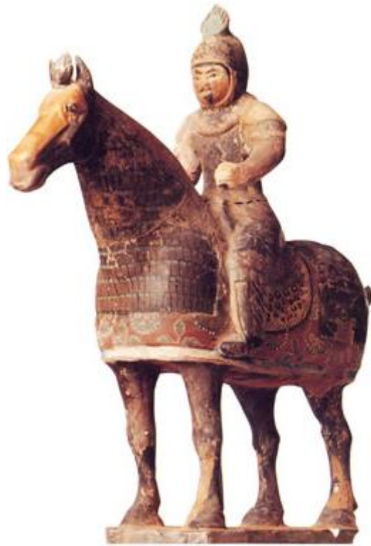
唐代彩繪甲馬武士俑

戰爭時除了徵發府兵，還要招募普通的老百姓當兵。唐朝政府設置了勳官，授與作戰有功人員。對於作戰有功的將士，還給予豐厚的賞賜，有的並且可以授予官職。薛仁貴就是因為作戰英勇，由白丁一躍而被任命為從五品的游擊將軍。這些辦法對於吸引老百姓從軍，提高軍隊的戰鬥力起了有力的作用。這也是唐太宗對外戰爭的強大後盾。