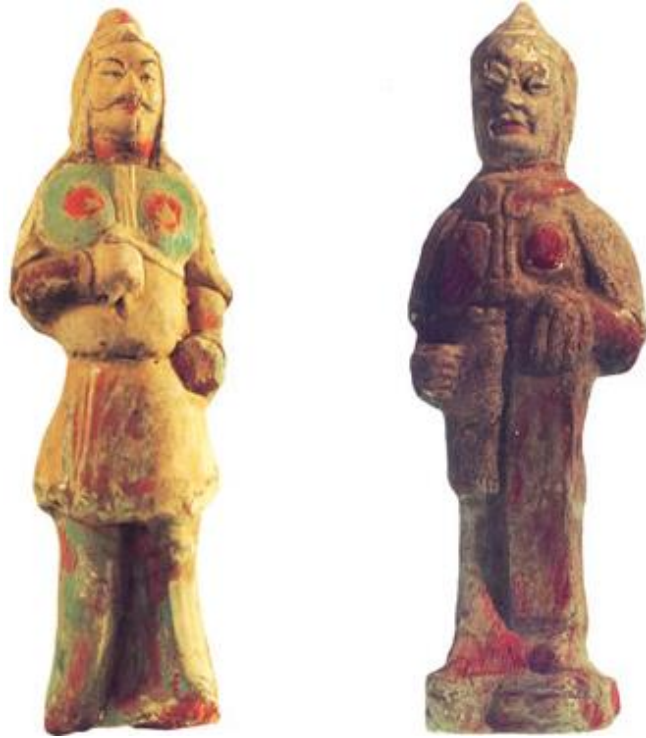
唐太宗昭陵出土的彩陶唐代武士俑