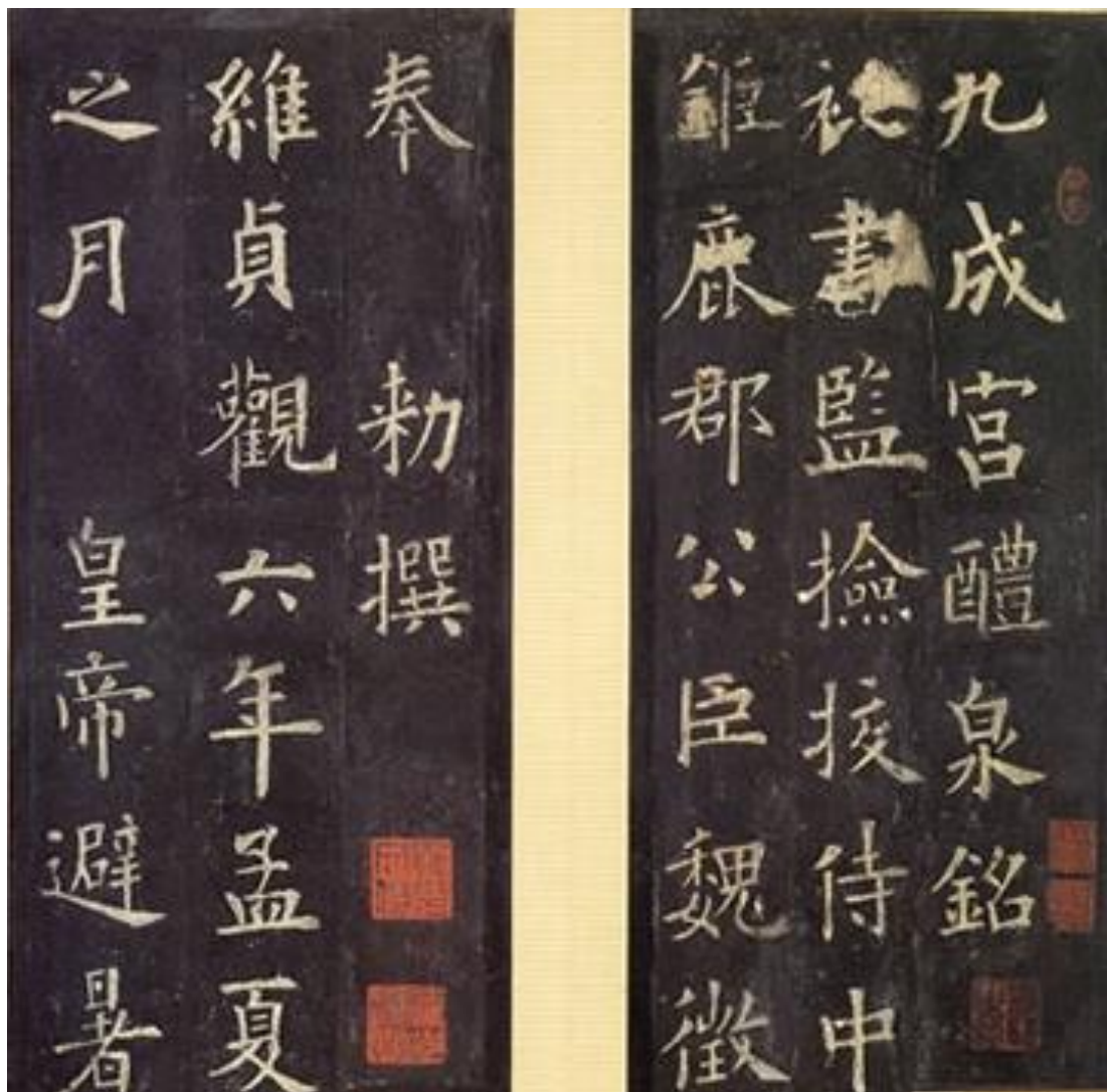
《唐九成宮醴泉銘》，北宋拓本

唐太宗即位後，與大臣一起探求治道政術，並身體力行，很快就達到了致治的局面，社會安定，恢復生產，人民安居樂業，國力日益強盛。貞觀時期，朝廷上下形成了一種古代王朝少有的政治文化：皇帝兼聽納諫，廣任賢良；大臣敢於發表和堅持自己的意見，上下齊心一致，力求致治。同時，修史編書，大辦學校，也使學術文化有了很大的發展。此外，唐太宗還厲行法治，要求一切以法為準。凡此種種，締造了歷史上有名的「貞觀之治」。