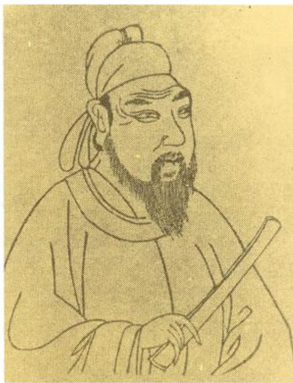
唐代修纂《五經正義》的孔穎達

唐太宗很重視歷史，在和大臣討論的時候，經常從歷史史實中引申出很有意義的治國理論。大臣們也常常引用歷史來說明自己的觀點。為了總結前代的歷史，太宗下令設立史館，修撰了《梁書》、《陳書》、《北齊書》、《周書》、《隋書》和《晉書》等六部史書。二十四史中有六部，也就是四分之一都成書於唐太宗時期。