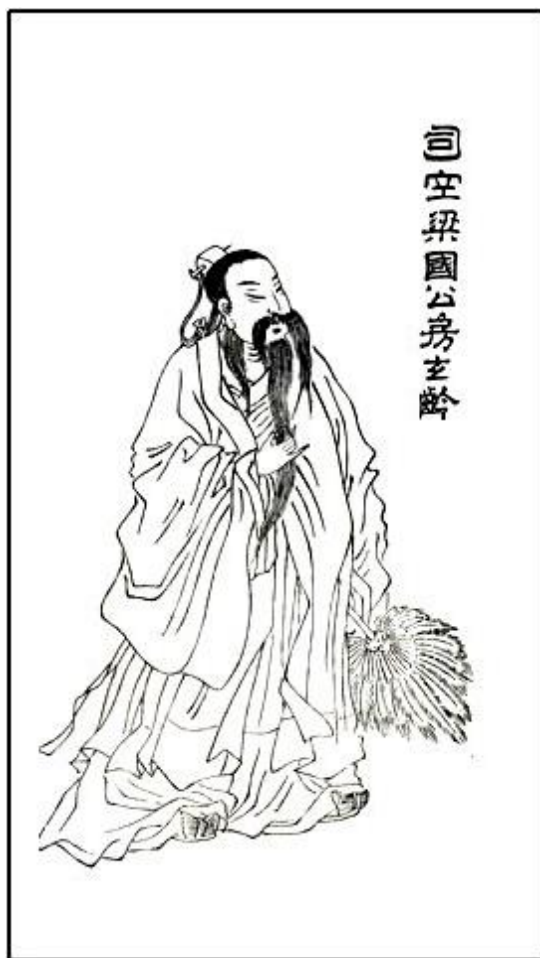
司空梁國公房玄齡畫像

房玄齡在隋朝做過縣尉，後被免職。唐太宗在渭北作戰的時候，見到房玄齡，一見如故，便讓他擔任秦王府記室參軍。每次戰爭結束，眾人競求金寶，房玄齡則忙於為李世民的幕府搜羅人才。同時結交謀臣猛將，使他們為李世民效力。唐太宗即位後，他被任命為中書令，後調任尚書左僕射。房玄齡擔任宰相以後，參與典章制度的制定和政府機構的調整，並主持修定法律。同時，他也非常重視各級官員的選任，不論貴賤只根據各人的能力、才識加以任用。有一次戶部尚書空缺，由於沒有合適的人選，他便自己兼管戶部。房玄齡盡心竭力，時刻關心政府的各項事務，唐太宗因而把他看作是自己的左右手。