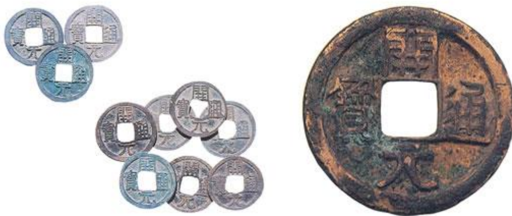
唐高祖廢隋五珠錢，改鑄開元通寶錢

中原和山東農村的情況有了很大變化，行旅不必自帶乾糧，沿途可以得到供應。旅客進入山東後，會得到優厚的供給與接待，有的在離開時還受到饋贈。可見，社會開始出現了小康的局面，而這是廣大人民經過十幾年艱苦勞動，戰勝生產資源的缺乏，戰勝嚴重的自然災害等重重困難，才取得偉大的成就。但是，從全國整體的情況來看，貞觀時期的經濟遠遠沒有達到隋代的水平。河北地區還是處在恢復的階段。全國人口，直到高宗永徽三年（公元 652 年）也才增加到 380 萬戶，比起隋代的 900 萬戶，還差得很遠。