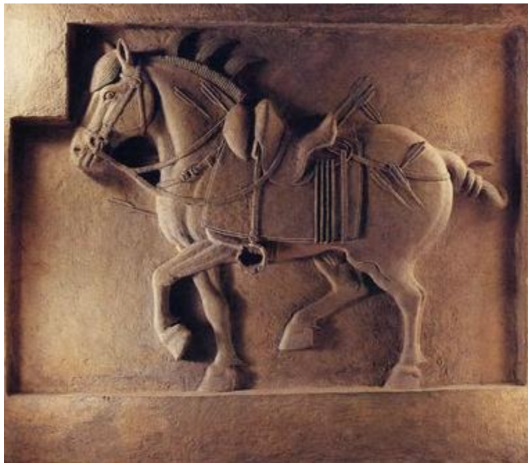
昭陵六駿之五：拳毛騏

唐軍與劉軍相持達六十日之久，有一次李世民本人也被劉軍包圍，險些做了俘虜。最後，李世民採用事先在洺水上游築堰，於決戰時用決堰放水的辦法，才把劉的軍隊打敗。但李世民繼續採用殘酷的辦法，懲治起義的人民，這為劉黑闥的再起埋下伏線。果然，半年後，劉黑闥利用人民的報復反抗心理，東山再起。這次奉命征討的太子李建成，採用魏徵的建議，實行政治瓦解的辦法，釋放全部被俘的劉黑闥軍將士，對參加起兵的不予追究，以爭取民心，最後才平息了河北、山東地區人民的反抗活動。