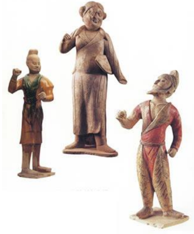
西安出土的各種胡人俑

化政策，大大推動了北方各民族的融合。各民族的一些風俗習慣也為漢族所接收，特別是飲食、服飾等方面。在民族融合基礎上所形成的各種風俗習慣，直到唐朝仍然保留在社會生活中。唐朝的服裝，特別是婦女的服飾很有特點，就是因為吸收了各民族服飾的特點。正因為如此，後來有人說唐人大有胡人之氣。