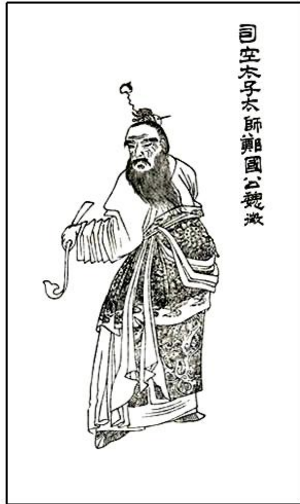
司空太子太師鄭國公魏徵畫像