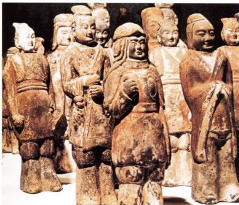
北魏彩繪陶文武士俑

北周、隋和唐的皇帝都出自這個集團。不同的是，在西魏和北周，鮮卑貴族佔據主導地位，而自隋開始，關隴貴族中起主導作用的是漢族貴族。隋文帝楊堅、唐高祖李淵都出身於關隴貴族家庭，他們的母系都有鮮卑血統，但他們的父系都是漢族。