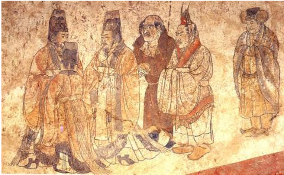
唐代禮賓圖，左起三人為唐代迎送賓客的鴻臚寺官員；第四人為東羅馬帝國使節；第五人為高麗或日本使節；第六人為中國少數民族使節

唐太宗一直把「華夏安寧」、「遠夷率服」作為致治的兩個主要標誌。在民族關係方面，他接受大臣們的意見，有步驟地解決邊疆問題，並且實行比較開明的民族政策。太宗先後降服了東突厥，平定了吐谷渾，經營西域，通婚吐蕃，打敗長期寇邊的薛延陀，為發展和鞏固中國成為統一多民族的國家作出了貢獻。