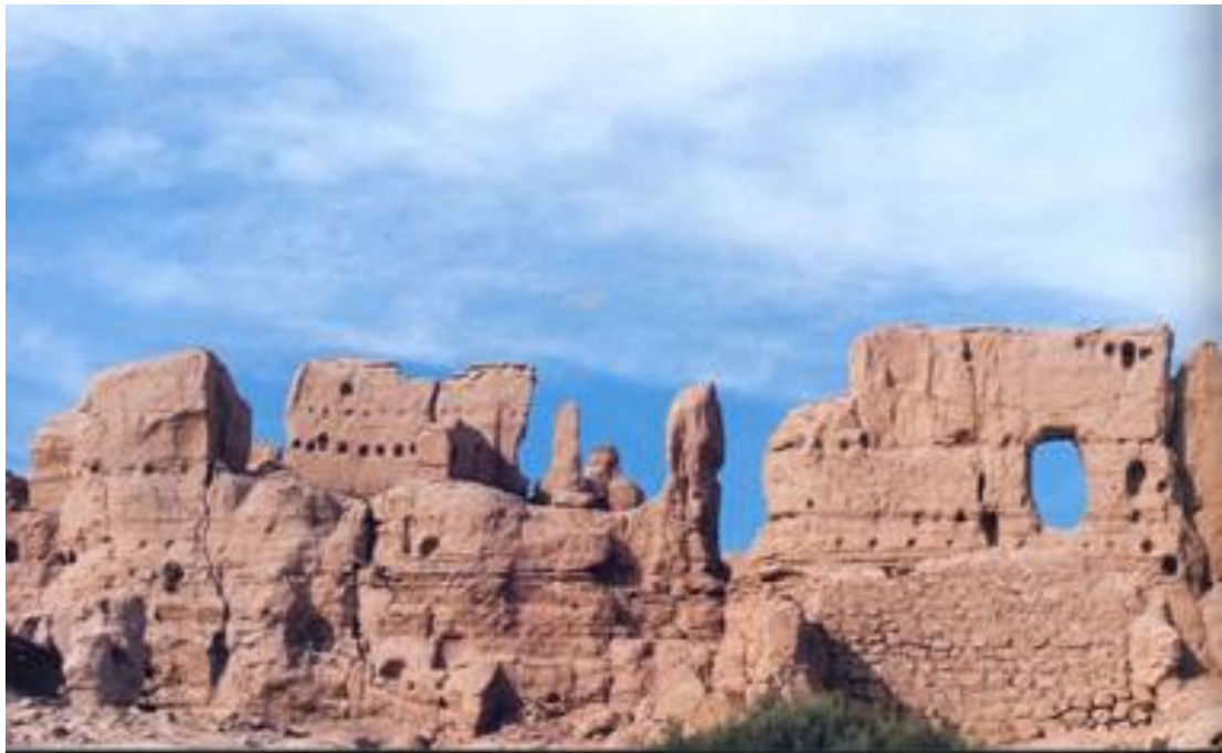
交河故城遺址，位於新疆吐魯番以西雅爾湖鄉，是古代絲綢之路的重要城市

唐以突厥貴族阿史那社爾為昆丘道行軍大總管，於貞觀二十二年（公元 648 年）攻破龜茲（今新疆庫車）。唐把安西都護府從西州遷到龜茲，下統焉耆、疏勒、于闐（今新疆焉耆、喀什、和田）和龜茲四鎮，歷史上稱之為安西四鎮。唐太宗還任命原西突厥葉護阿史那賀魯為瑤池都督。此時，唐對西域的影響已大大加強。