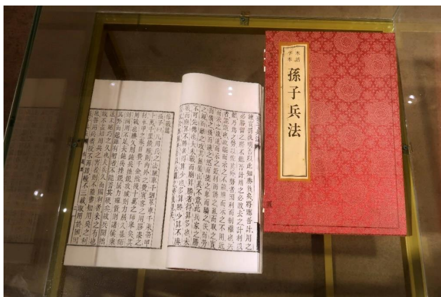
木活字本《孫子兵法》

嚴明紀律：人都有惰性和弱點，真正用好人，光靠愛心和獎勵是不夠的，還必須依靠嚴格的紀律與法制來約束。孫子認為，軍隊首先要嚴明紀律。孫子成功訓練吳國宮女的故事，就證明了嚴明紀律的作用。因此，他主張用愛心感化士卒後就要用嚴法、賞罰來命令他們，讓他們既感恩，又畏威，不敢以身試法。他認為只有嚴明紀律，才能使全軍將士「齊勇若一」，指揮整個軍隊，就像指揮一個人一樣整齊統一。的確，紀律是軍隊的生命，一支部隊如此，一個單位，一個集體，一個企業又何嘗不是這樣呢？