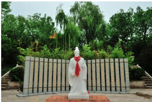
山東青島舉辦世界園藝博覽園內孫子和他的《孫子兵法》雕塑

現代對《孫子兵法》的研究和應用：在現代歷史上，毛澤東對《孫子兵法》的推崇和精通是人所共知的，並將其中的合理內容創造性地運用於指導戰爭的實踐上。這個時期的《孫子兵法》研究應用特點是：（一）研究領域進一步拓寬；（二）在應用方面已被廣泛運用於政治、經濟、外交和商貿競爭等各個領域中。