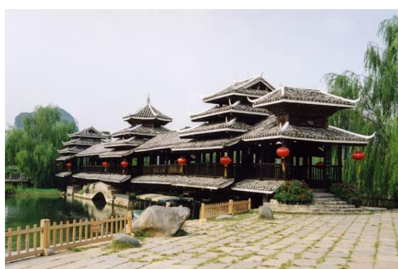
侗寨风雨桥