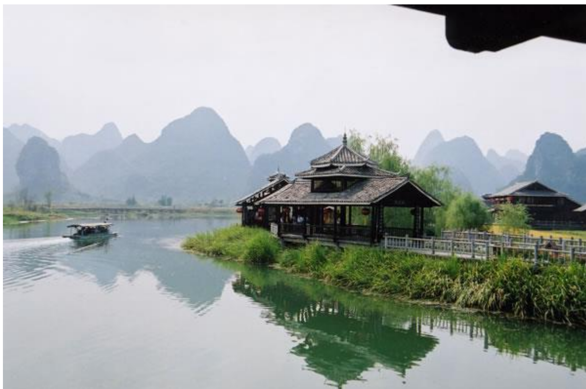
风景如画的壮寨（平子摄）

如果我们沿着清澈的漓江，攀登树木茂密的群山，走村寨，过风雨桥，住鼓楼，和好客的村民一道参加歌墟、赶坡会，一定能领略到民俗风情的神奇又迷人的魅力。