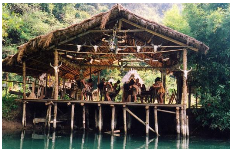
壮族原始部落

傩舞是面具舞。面具制作讲究突出形象性，根据各神的性格特点而有不同的装饰和鲜明的色彩，雕刻手法极为夸张。桂林傩舞面具在宋代就蜚声域外，那时，一个制作精细的面具可贵达一万钱。