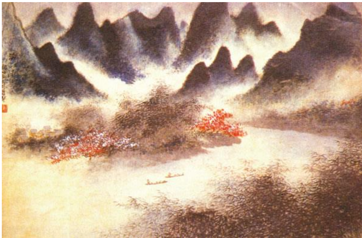
漓江春雨（胡佩衡画）

胡佩衡（1892—1962年）是位蒙古族画家。蒙古多草原，少水，但胡佩衡的作品却常表现水。画面水意十足。在画作《漓江春雨》中，画家在远山各个山头之间运用“空白”来显示烟雨云雾，虽是“空白”，却仿佛让人一伸手就能抓到一把水雾气来。两岸翠竹夹漓江，江中小船渔夫，色彩用得很厚，墨色却极富韵味。