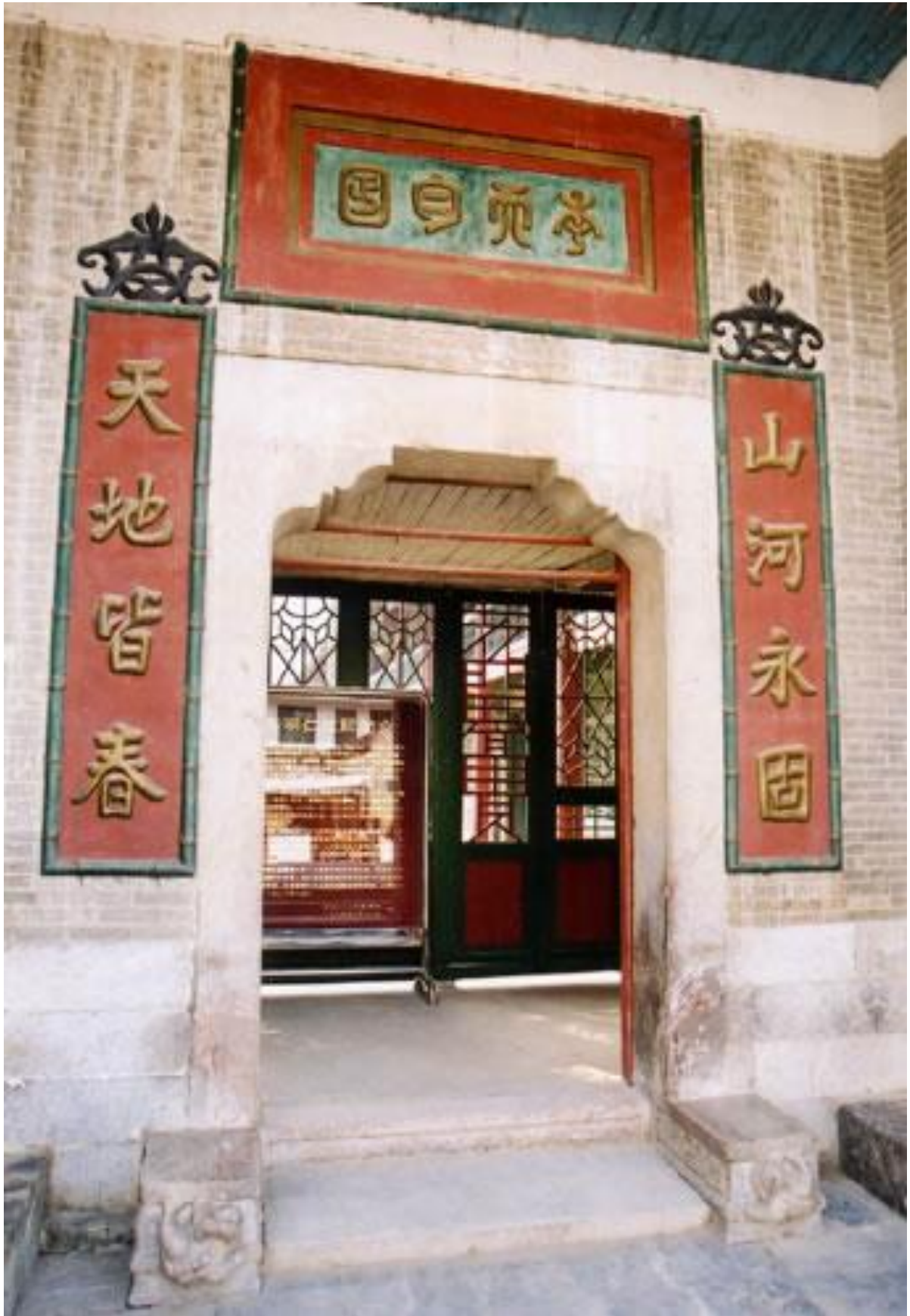
李宗仁先生故居门口