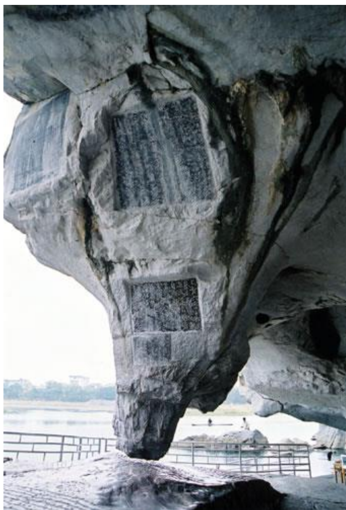
伏波山内试剑石

奇石是桂林“四绝”之一。桂林奇石形态美，图案美，色彩美，斑纹美，具有很高的欣赏和收藏价值。大自然的鬼斧神工制造了桂林奇石。桂林地区有独特的喀斯特地形地貌，多山脉，两山之间必有一水，沟谷地溪流纵横。这里雨量充沛，常年水流不断，高落差水流不断汇集，切割侵蚀作用异常强烈，使深埋地底的原石露出地面。这里特有的坚硬细密的优质原生岩石，或被风吹雨打，或被水流带走，经过亿万年的翻滚冲磨，终于形成了各式各样的奇石。这些奇石浑圆多姿，色彩美观，石纹丰富，成为历代收藏的珍品。