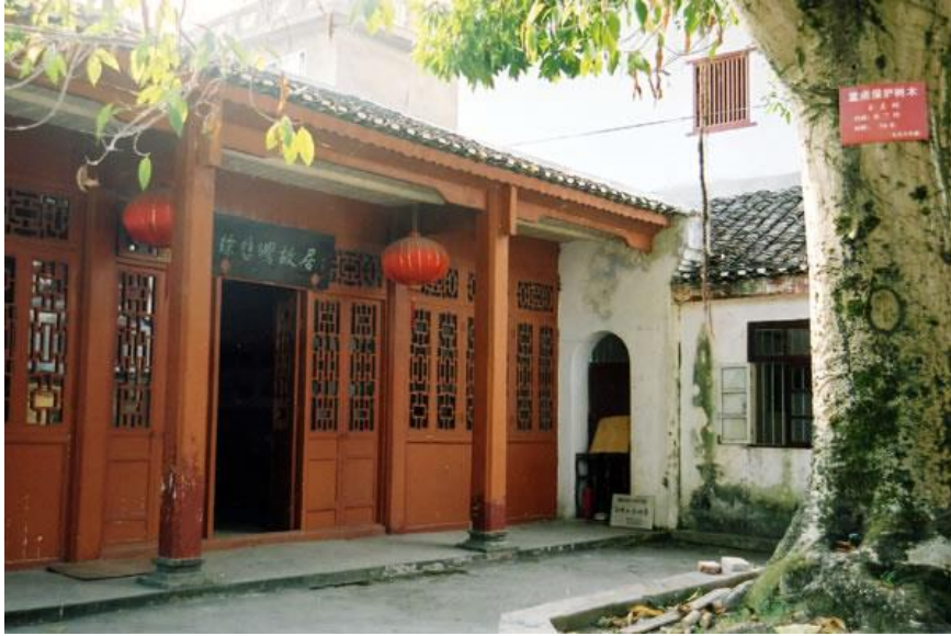
徐悲鸿故居