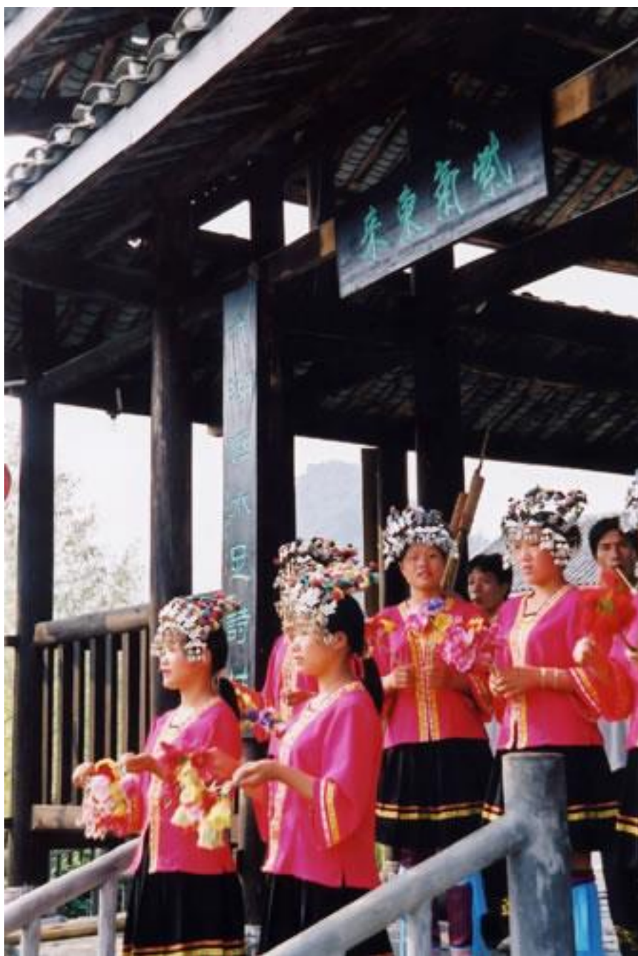
苗族迎客舞

农历正月初三至初五，是苗族男女青年赛芦笙，交朋友的日子。那几天，男的身背芦笙，女的满身银饰，欢欢喜喜去参加一种叫“游方”的活动。“游方”也叫赶坡会，一声锣鼓响过之后，小伙子们在姑娘们的注视下，吹奏芦笙跳舞，个个拿出自己的绝招，前转后跳，舞姿雄劲。姑娘们一边踏着乐声漫舞，一边挑选意中人，看中了，就走上前去，在意中人的芦笙上系一条彩带，并且手牵彩带，伴着芦笙起舞。暮色降临，对对情侣相约，或唱情歌，或互赠信物，共度一个难忘的良宵。