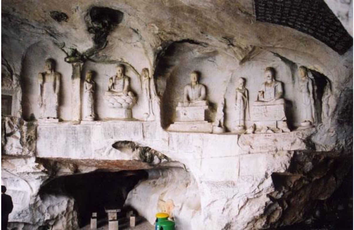
伏波山內的千佛岩是历代造像宝库