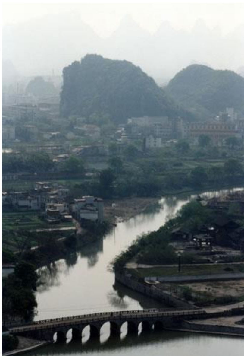
桂林山水

杜甫（公元 712—770 年），唐朝著名诗人。他虽然没有到过桂林，但对桂林极为向往，写诗表达自己对桂林的喜爱。