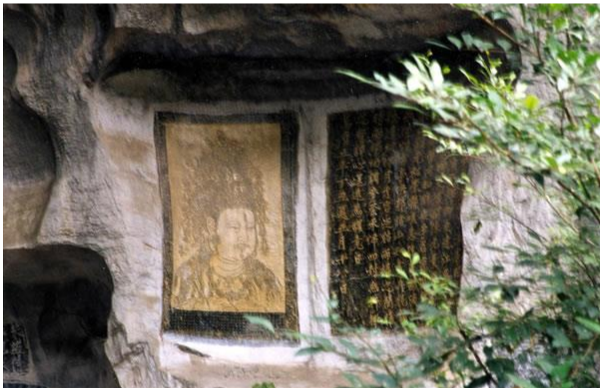
桂海碑林观音画像