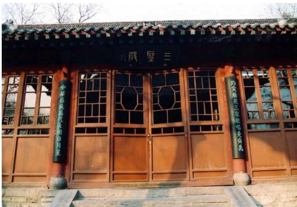
祭祀尧、舜、禹的三圣宫。

相传舜帝有两个妻子——娥皇和女英。舜帝南下桂林时，娥皇和女英闻讯赶去。她们过长江、洞庭湖，一路南下，半途获悉丈夫突然去世的消息，痛不欲生、泪如雨下。据说，她们的泪水把山上的竹子都打成斑斑点点的，这些竹后来被称为斑竹。最后，娥皇和女英双双投入湘江，以死殉来表示对丈夫的深情。为了纪念她们，后人在城北的半云山修了坟墓。墓高十余丈，名曰“双妃冢”