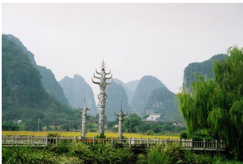
少数民族图腾