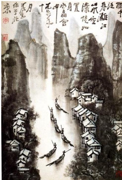
雨中漓江（李可染画）

李可染（1907—1989年）现代著名画家，五十年代曾经先后十次到桂林、黄山等地写生，行程数十万里，画稿数百幅，形成自己独特的风格。他的画，融会中西，尤其是把西画中的明暗处理引进中国画，使之和谐地融化在深厚的传统笔墨和造型意象之中。代表作《漓江细雨》以淡墨画山，一笔笔画出既空蒙灵透，又得山之骨。细雨中，江面几只小船，飘飘慢行，如入梦境。