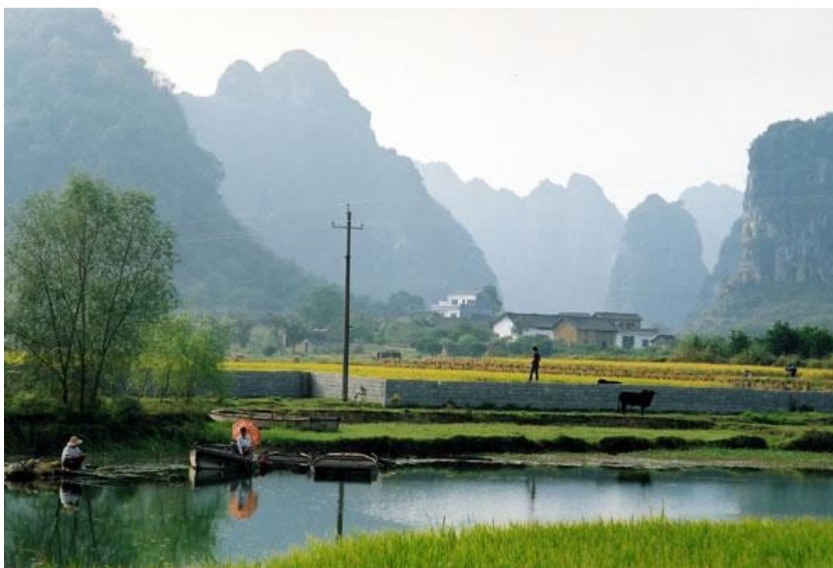
阳朔县内环山抱水景色美丽

韩愈（公元768—824年），唐朝文学家，后世列为“唐宋八大家”之首。桂林的行政长官严谟和韩愈是好朋友，韩愈作了一首诗为他送行。韩愈未曾来过桂林，但他的《送桂州严大夫》却成为描写桂林山水的千古绝唱。诗中第三四句最精彩，前句写水，后句写山，山水对峙，动静结合，形象而准确。现在人们一提起桂林，很自然就想起这句诗。