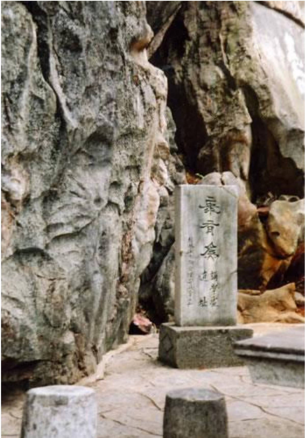
靖江王城遗址内的康有为讲学处