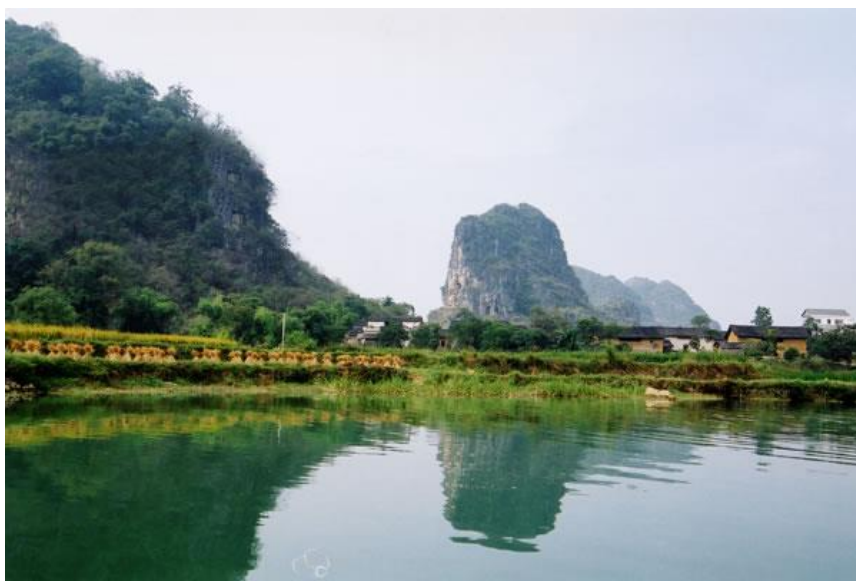
伏波山下的村庄