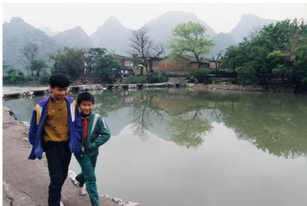
桂林市郊的农家风光