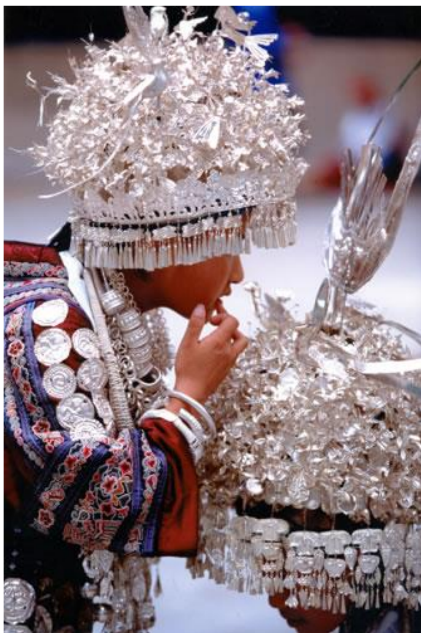
苗族少女

夜晚，月亮升到空中。少女们相约聚集在某家的木楼上，说说唱唱，纺纱织布，等待男孩子们到来。少男们穿戴整齐，走村串寨，去寻找自己心中的姑娘。听到少男的脚步声，姑娘们停止说唱，但纺织车仍在转动，表示她们在等待。少男轻轻走上木楼，坐在火塘边弹琴吹箫，姑娘们和唱。如果双方有意，就单独对唱。走寨直到月亮西沉才结束。走寨期间，父母和兄长不干涉少女们的交友自由。