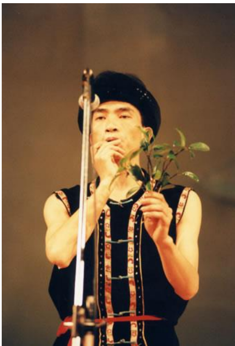
壮族青年吹奏树叶

歌手相逢，相互对歌。对歌时，姑娘会向自己的意中人抛出绣球表示爱情，对方若有意，则在绣球上系礼物，回赠女方。男方也可主动出击，用手上的彩蛋碰姑娘手中的彩蛋，姑娘如愿意和他做朋友，就露半边蛋让他碰；不愿的话，就把整个蛋握住，不让他碰到。