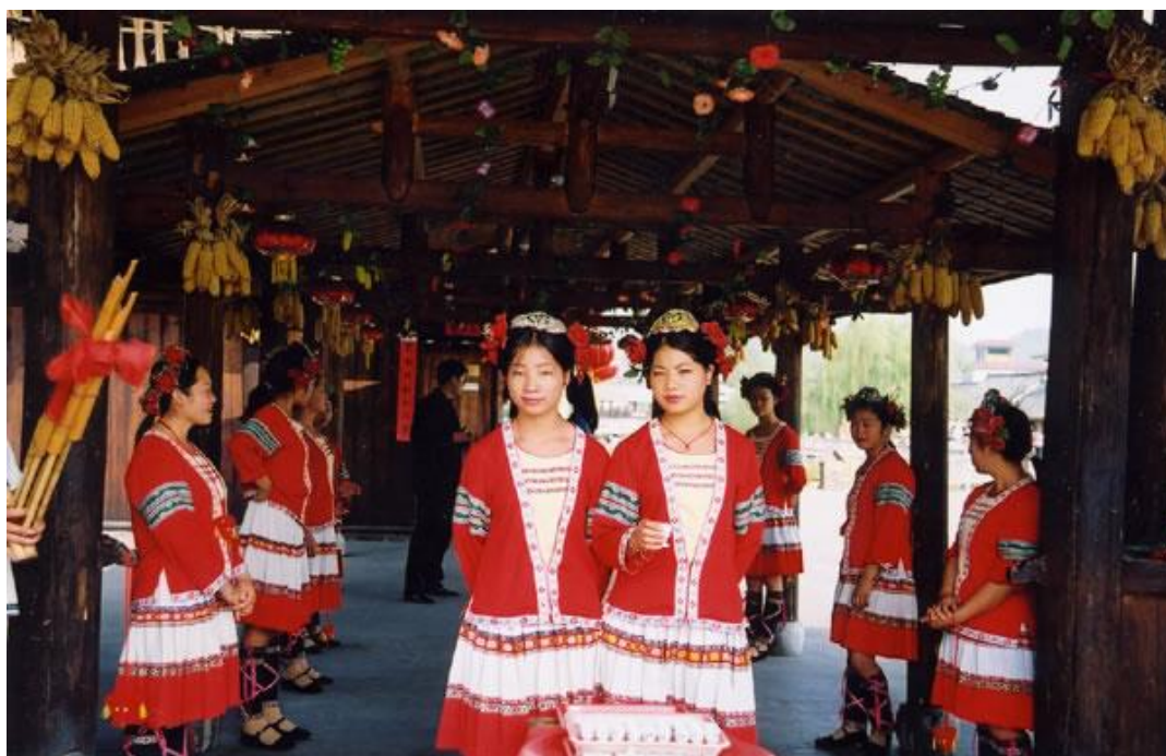
瑶家少女敬米酒迎客人