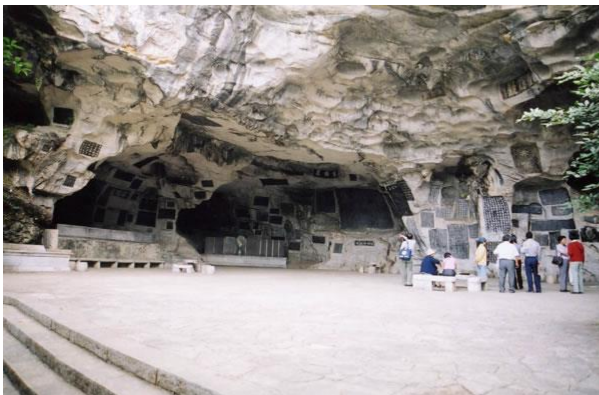
桂海碑林內的摩崖石刻

在宋朝的历史上，有一个有名的“元祐奸党”事件。宋崇宁四年（1105年），宋徽宗赵佶听信宰相蔡京主张，将元祐年间反对王安石新法的司马光、文彦博等309人列为元祐奸党，下令在全国刻碑立石，“以示后世”，这些碑叫作元祐党籍碑。第二年，由于朝野反对，皇帝又下诏将元祐党籍碑全部摧毁。九十三年后，当年被列为元祐党人之一梁焘的曾孙梁津，根据家藏碑刻拓本，重新刻制了一块碑，它是现存唯一的一块元祐党籍碑，对于研究宋代朝政的争斗具有很重要的价值。