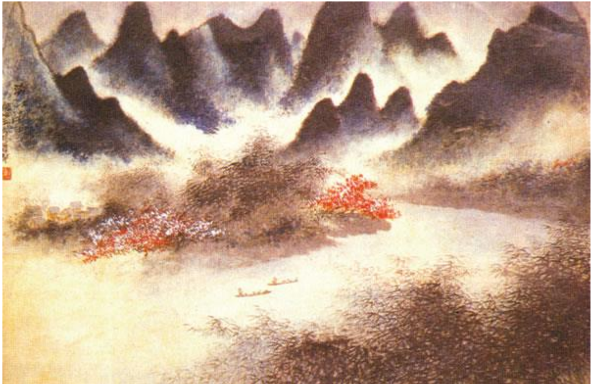
灘江春雨（胡佩衡畫）

胡佩衡（1892—1962年）是位蒙古族畫家。蒙古多草原，少水，但胡佩衡的作品卻常表現水。畫面水意十足。在畫作《灘江春雨》中，畫家在遠山各個山頭之間運用「空白」來顯示煙雨雲霧，雖是「空白」，卻彷彿讓人一伸手就能抓到一把水霧氣來。兩岸翠竹夾灘江，江中小船漁夫，色彩用得很厚，墨色卻極富韻味。