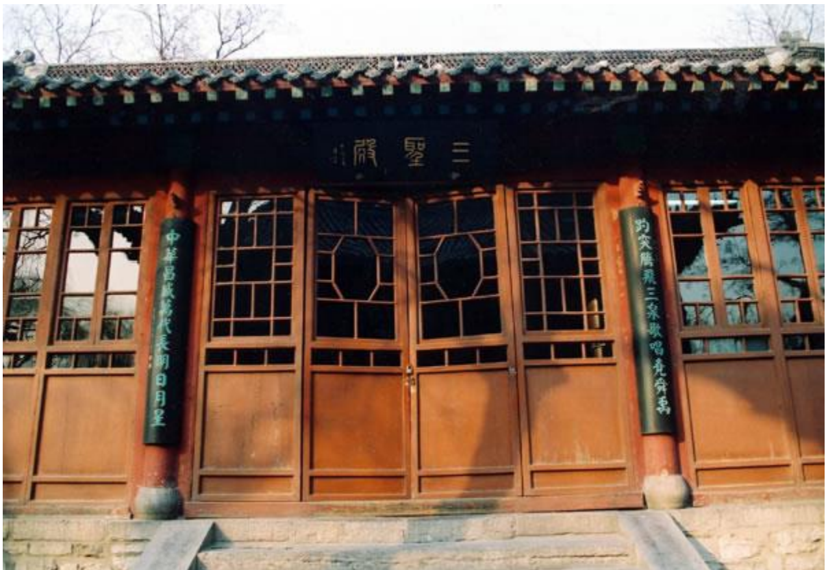
祭祀堯、舜、禹的三聖宮。

相傳舜帝有兩個妻子——娥皇和女英。舜帝南下桂林時，娥皇和女英聞訊趕去。她們過長江、洞庭湖，一路南下，半途獲悉丈夫突然去世的消息，痛不欲生、淚如雨下。據說，她們的淚水把山上的竹子都打成斑斑點點的，這些竹後來被稱為斑竹。最後，娥皇和女英雙雙投入湘江，以死殉來表示對丈夫的深情。為了紀念她們，後人在城北的半雲山修了墳墓。墓高十餘丈，名曰「雙妃塚」