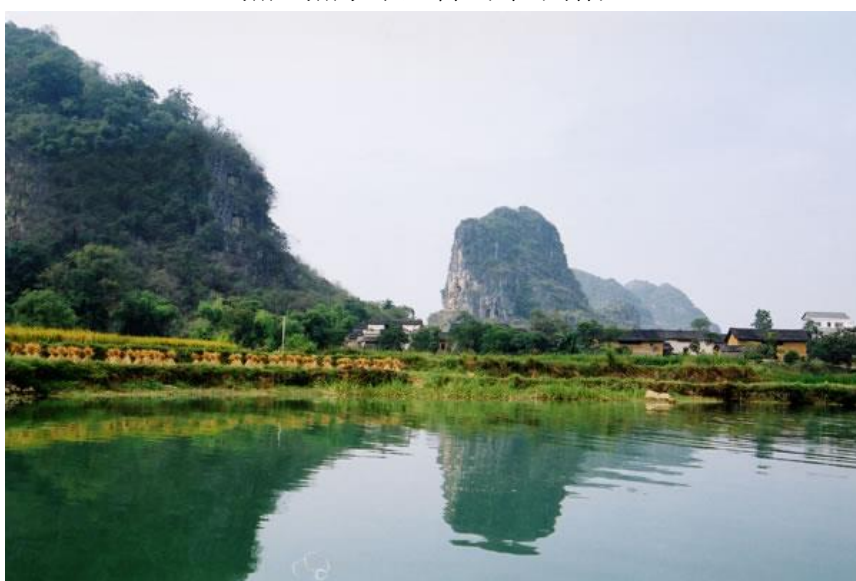
伏波山下的村莊