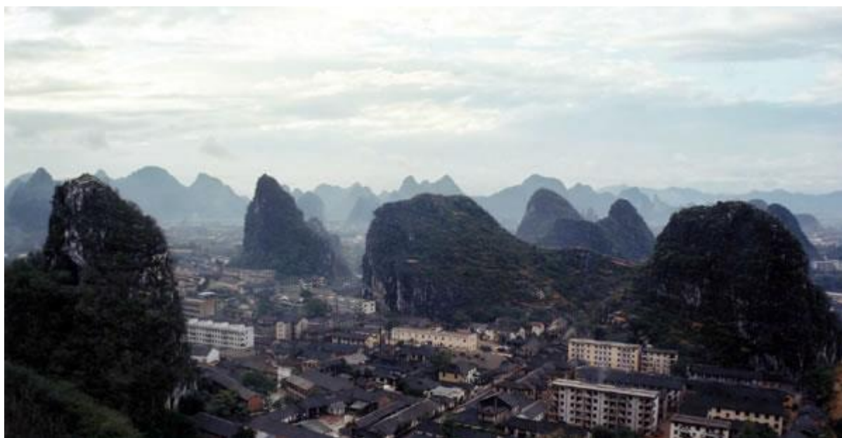
「四野皆平地，千峰直上天。」

桂林是進入廣西的咽喉要地，歷來是兵家必爭。桂林城北，有一座鐵封山，它像一道天然的屏障，擋住了多次外敵的進攻，被譽為「鐵鎖掣關」。鐵封山位於桂林城北，海拔 248.6 米，與鸚鵡山對峙。兩山之間有狹窄通道，道旁高崖絕壁，形勢險要。南宋時代，桂林城擴大，在兩山之間的隘口設立桂林城北門——安定門。城牆依山勢而築，易守難攻，有「鐵封鸚鵡鎖北關」之稱。鐵封山半腰有碑刻《平蠻頌》，記述唐朝大曆十二年（公元 777 年）平定西原騷亂的經過，是桂林最早記述民族衝突的碑刻。