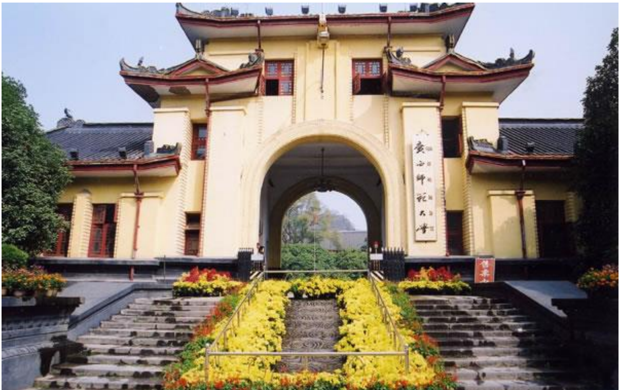
明代的靖江王府、清代的貢院，坐落在今天的廣西師範大學內。

李定國（1621—1662年），明末抗清名將。早年家貧，跟隨張獻忠起兵反明，作戰英勇，被張獻忠收為義子。張獻忠戰死後，與孫可望等率部聯明抗清。李定國與孫可望等率部繼續義軍活動，清兵入關後，李定國聯明抗清。永曆六年（1652年），李定國率軍進入廣西，攻克桂林，乘勝北上，連克永州、衡陽。永曆十年，李定國密迎南明永曆皇帝到雲南，進一步抗擊清兵。不料此時，孫可望投順清朝，將西南防務機密全部向清朝密告，清軍大舉進攻，李定國轉戰不利，退入緬甸。康熙元年（1662年），南明永曆皇帝被殺，李定國悲痛欲絕，不久也死去。